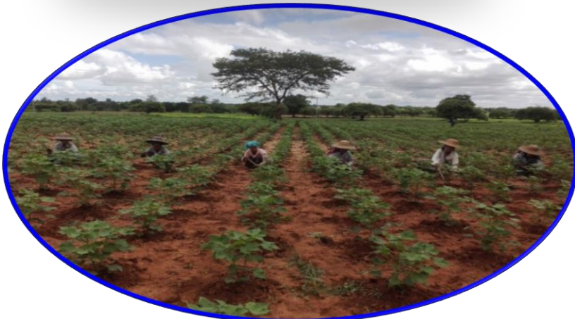
ပေါင်းရှင်းနေပုံ