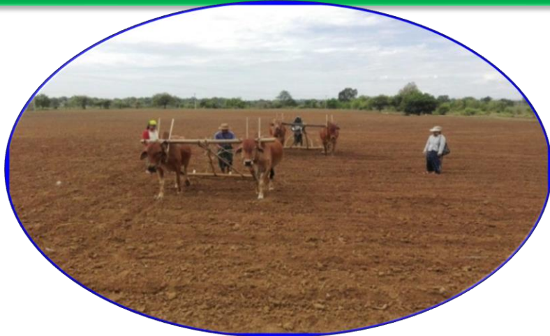
စိုက်ကြောင်းဆွဲနေပုံ