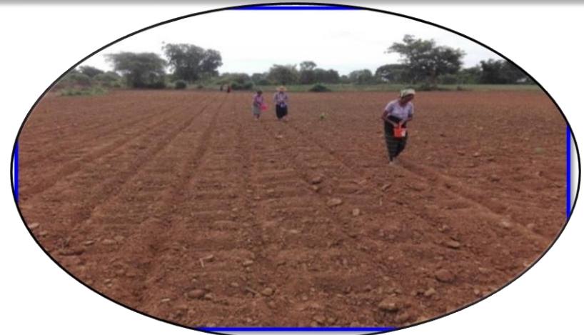
မျိုးစေ့ချနေပုံ