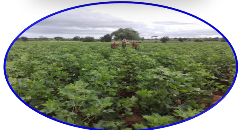
ကြားပေါင်းလိုက်နေပုံ