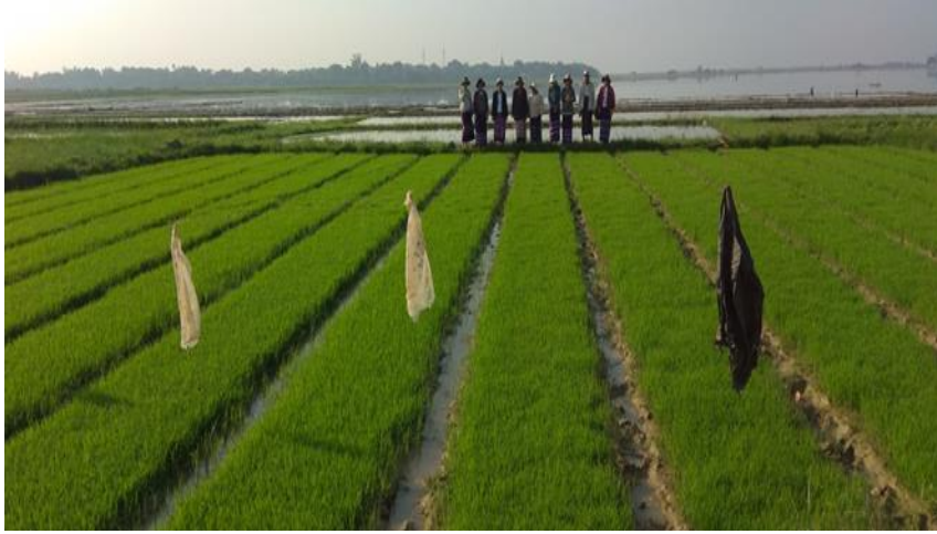
ပျိုးထောင်ခြင်း