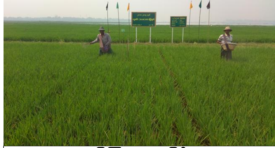
မြေဩဇာကျွေးခြင်း