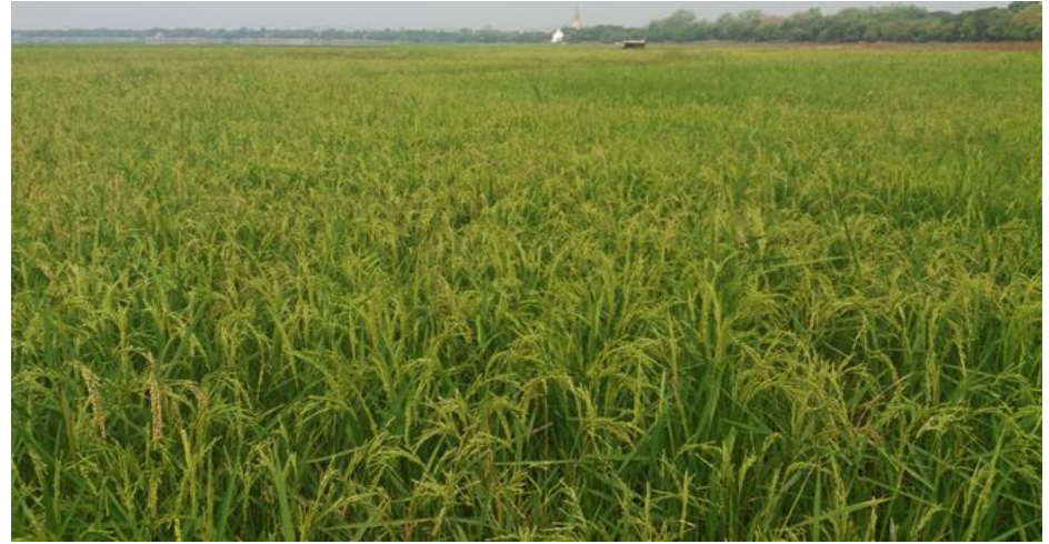
ရင့်မှည့်ချိန်