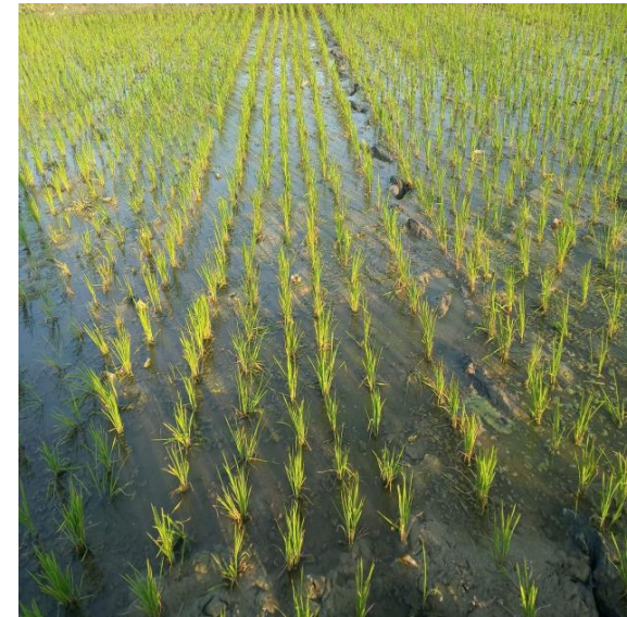
ကောက်ပင်လှန်ချိန် 9