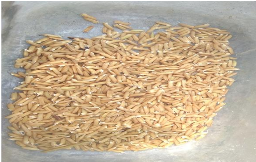
ပျိုးဖောက်ခြင်း