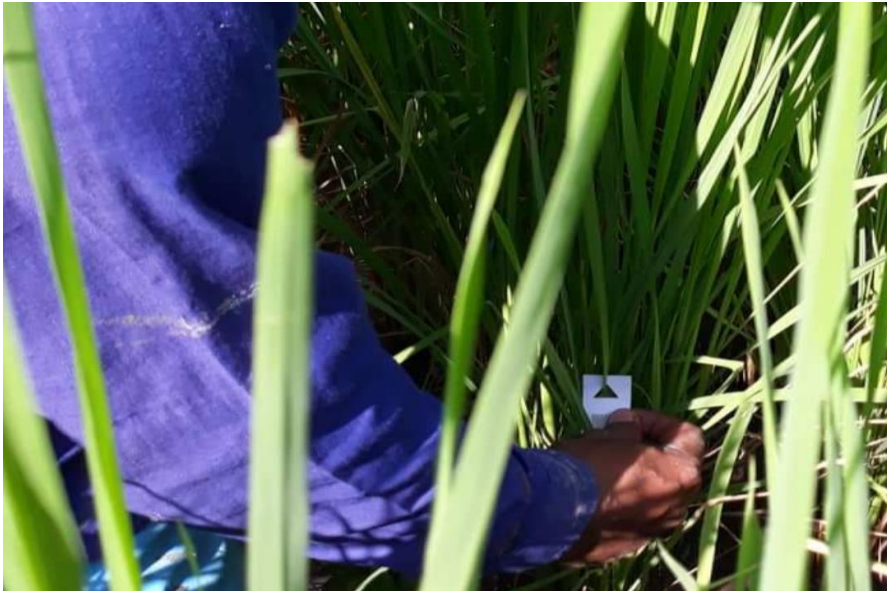
ဥကပ်ပါးနဂျီကပ်ခြင်း