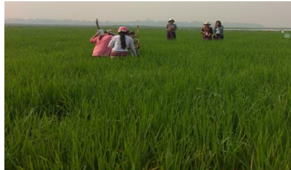
Data ကောက်ယူခြင်း