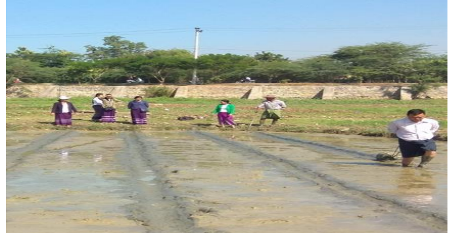
ပျိုးဘောင်ဖော်ခြင်း