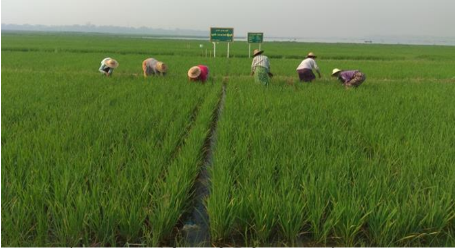
ပေါင်းနှုတ်ခြင်း