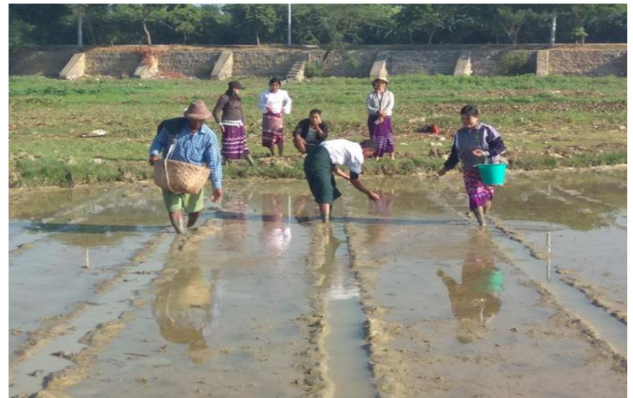
ပျိုးစေ့ချခြင်း