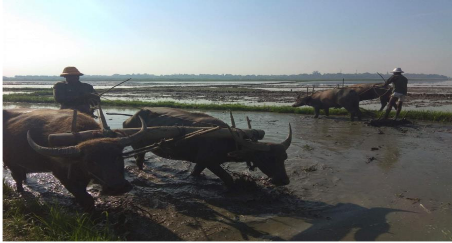
မြေပြင်ခြင်း