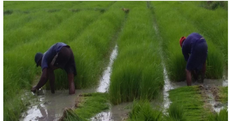
ပျိုးနုတ်ခြင်း