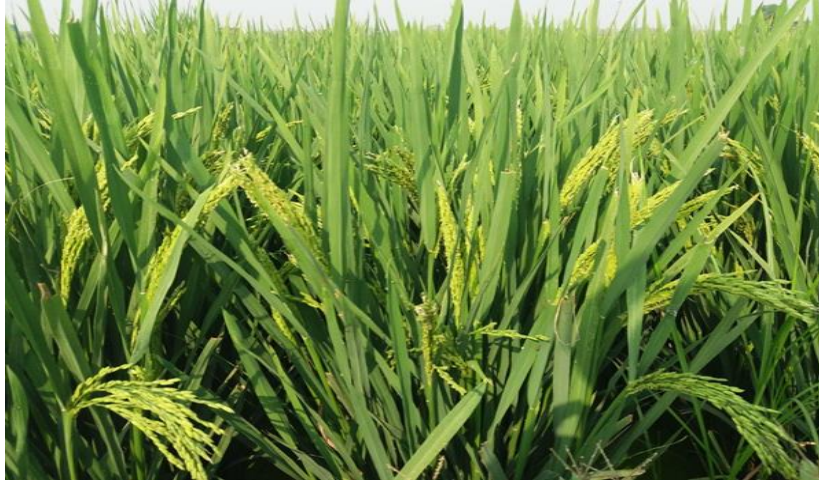
အနံ့ထွက်ပန်းပွင့်ခြင်း