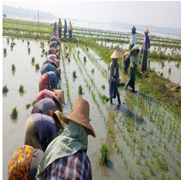
ကောက်စိုက်ခြင်း