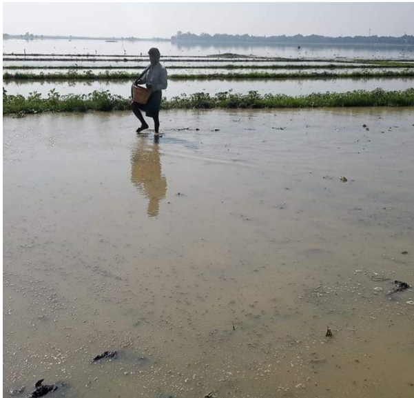
မြေခံထည့်ခြင်း