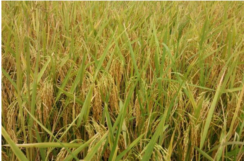
ရင့်မှည့်ချိန်