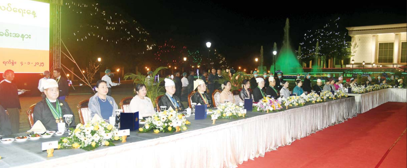
နိုင်ငံတော်စီမံအုပ်ချုပ်ရေးကောင်စီဥက္ကဋ္ဌ နိုင်ငံတော်ဝန်ကြီးချုပ် ဗိုလ်ချုပ်မှူးကြီး သတိုးမဟာသရေစည်သူ သတိုးသီရိသုဓမ္မ မင်းအောင်လှိုင်နှင့် ဇနီး ဒေါ်ကြူကြူလှတို့က တည်ခင်းဧည့်ခံသည့် (၇၇)နှစ်မြောက် လွတ်လပ်ရေးနေ့အထိမ်းအမှတ် ဂုဏ်ပြုညစာစားပွဲနှင့် ဂုဏ်ပြုဖျော်ဖြေပွဲအခမ်းအနားသို့ တက်ရောက်ကြသူများကို တွေ့ရစဉ်။

ရင်းရင်းနှီးနှီး နှုတ်ဆက် နိုင်ငံတော် စီမံအုပ်ချုပ်ရေး ကောင်စီဥက္ကဋ္ဌ နိုင်ငံတော် ဝန်ကြီးချုပ် ဗိုလ်ချုပ်မှူးကြီး သတိုးမဟာသရေစည်သူ သတိုး သီရိသုဓမ္မ မင်းအောင်လှိုင် နှင့် ဇနီး ဒေါ်ကြူကြူလှတို့က (၇၇)နှစ်မြောက် လွတ်လပ်ရေး နေ့ ဂုဏ်ပြုညစာစားပွဲ အခမ်းအနားသို့ တက်ရောက် လာကြသူများအား ရင်းရင်း နှီးနှီးနှုတ်ဆက်စဉ်။