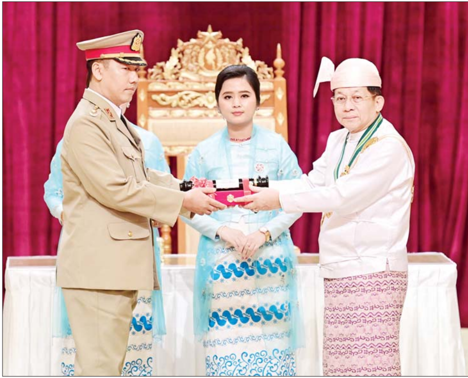
နိုင်ငံတော်စီမံအုပ်ချုပ်ရေးကောင်စီဥက္ကဋ္ဌ နိုင်ငံတော်ဝန်ကြီးချုပ် ဗိုလ်ချုပ်မှူးကြီး သတိုးမဟာသရေစည်သူ သတိုးသီရိသုဓမ္မ မင်းအောင်လှိုင် သူရဘွဲ့ရရှိသူ ကာကွယ်ရေးဝန်ကြီးဌာနမှ ဗိုလ်မှူးကြီး ဝဏ္ဏလှိုင်အတွက် ဂုဏ်ထူးဆောင်ဘွဲ့ချီးမြှင့်ရာ ဗိုလ်မှူးကြီး ကျော်ဇေယုက(ကိုယ်စား) လက်ခံစဉ်။