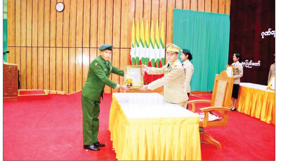
ဘွဲ့တံဆိပ်နှင့် လက်မှတ်ရရှိကြသူများနှင့်အတူ လက်ဖက်ရည်ဝိုင်းဖြင့် တည်ခင်းဧည့်ခံခဲ့ကြကြောင်း သိရသည်။

ဦးစွာ တိုင်းမှူးများက ဂုဏ်ပြုအမှာစကားများ ပြောကြားကြသည်။ ထို့နောက် တပ်မတော် စွမ်းရည်သတ္တိဆိုင်ရာ ဂုဏ်ထူးဆောင်ဘွဲ့တံဆိပ်နှင့် လက်မှတ်ရရှိကြသူများအား နိုင်ငံတော်စီမံအုပ်ချုပ် ရေးကောင်စီဥက္ကဋ္ဌ တပ်မတော်ကာကွယ်ရေးဦးစီး ချုပ်ကိုယ်စား တိုင်းမှူးများနှင့် တာဝန်ရှိသူများက တပ်မတော်စွမ်းရည်သတ္တိဆိုင်ရာ ဂုဏ်ထူးဆောင် ဘွဲ့တံဆိပ်နှင့် ဂုဏ်ပြုလက်မှတ်များ ပေးအပ်ချီးမြှင့် ကြသည်။ ထို့နောက် တိုင်းမှူးနှင့် တာဝန်ရှိသူများသည် တပ်မတော်စွမ်းရည်သတ္တိဆိုင်ရာ ဂုဏ်ထူးဆောင်