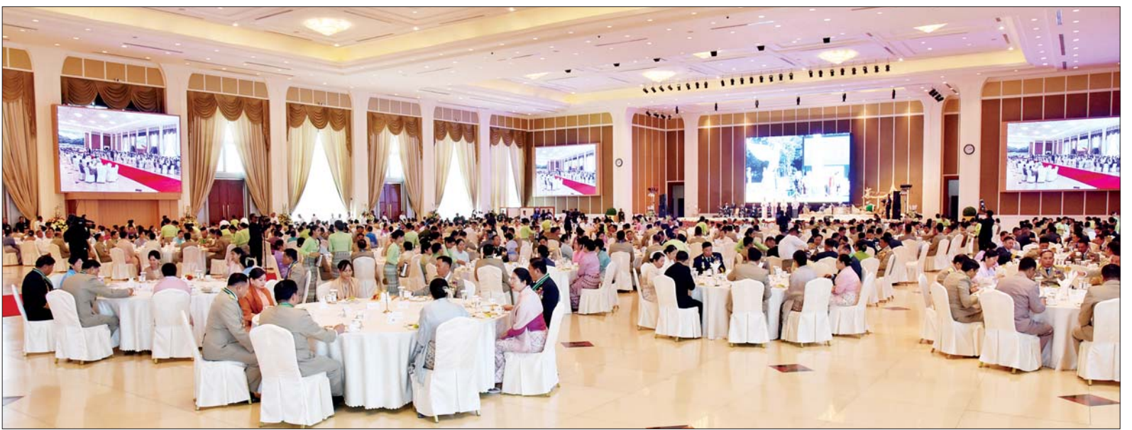
တပ်မတော်စွမ်းရည်သတ္တိဆိုင်ရာ ဂုဏ်ထူးဆောင်တံဆိပ်များ ချီးမြှင့်ခံရသူများကို လက်ဖက်ရည်ဝိုင်းဖြင့် တည်ခင်းဧည့်ခံစဉ်။

ဂုဏ်ယူဖွယ်တွေ့မြင်ကြရ တိုင်းပြည်ကာကွယ်ရေးအတွက် စစ်မြေပြင်တွင် ရှေ့တန်းကျကျ တိုက်ပွဲဝင်နေကြရသည့်တပ်မတော် သားများကဲ့သို့ပင် တပ်မတော် သားများ၏ ပါရမီဖြည့်ဖက် ရဲမေ များနှင့် မိသားစုဝင်များသည် လည်း နိုင်ငံတော်ကာကွယ်ရေး အတွက် အရေးကြီးသည့် အရန် အင်အားများပင် ဖြစ်ကြောင်း၊ တပ်မတော်သားများ၏ ပါရမီ ဖြည့်ဖက်ပီပီ သင်ကြား တတ်မြောက်ထားသည့် စစ်ပညာ များဖြင့် နိုင်ငံနှင့်လူမျိုးအကျိုး အတွက် အသက်ကို ပမာနမထား ဘဲ တိုက်ပွဲဝင်ခဲ့ကြသည်ကိုလည်း ဂုဏ်ယူဖွယ် တွေ့မြင်ကြရ ကြောင်း။ နိုင်ငံတစ်ခု ဖွံ့ဖြိုးတိုးတက် ခြင်း၏ အခြေခံသည် တည်ငြိမ်