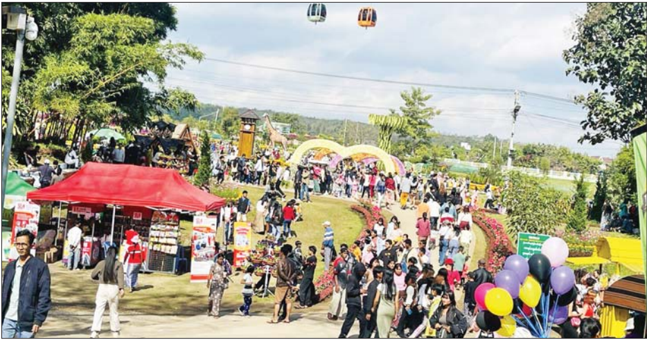
(၇၇) နှစ်မြောက် လွတ်လပ်ရေးနေ့တွင် ပြင်ဦးလွင်မြို့ရှိ ပွဲကောက်ရေတံခွန်သို့ လာရောက်လည်ပတ်အပန်းဖြေသူများဖြင့် စည်ကားလျက်ရှိသည်ကို တွေ့ရစဉ်။