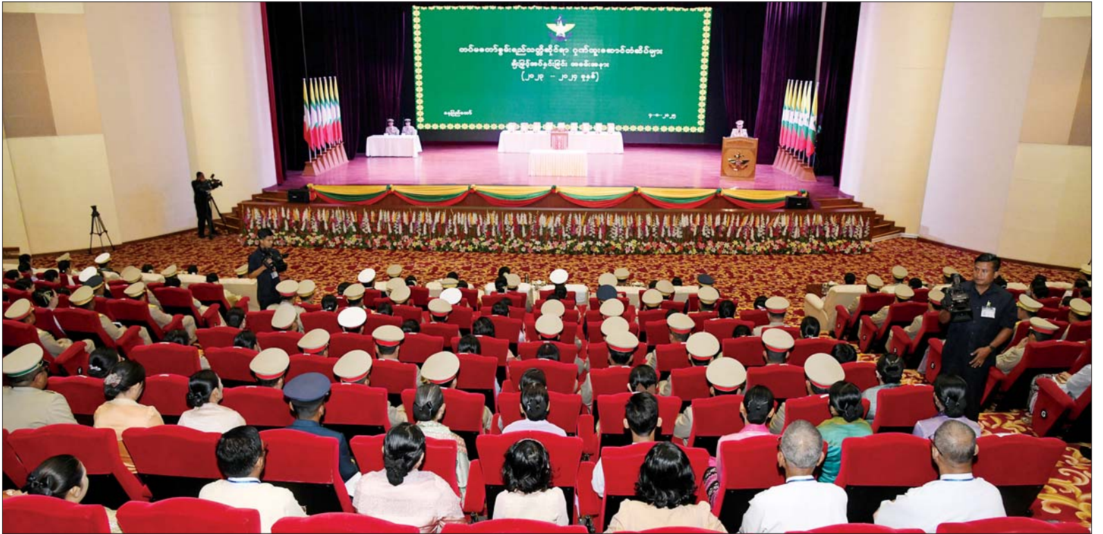
နိုင်ငံတော်စီမံအုပ်ချုပ်ရေးကောင်စီဥက္ကဋ္ဌ တပ်မတော်ကာကွယ်ရေးဦးစီးချုပ် ဗိုလ်ချုပ်မှူးကြီး သတိုးမဟာသရေစည်သူ သတိုးသီရိသုဓမ္မ မင်းအောင်လှိုင် တပ်မတော်စွမ်းရည်သတ္တိဆိုင်ရာ ဂုဏ်ထူးဆောင်တံဆိပ် ချီးမြှင့်အပ်နှင်းခြင်းအခမ်းအနားတွင် ဂုဏ်ပြုအမှာစကားပြောကြားစဉ်။

အဆိုပါ အခမ်းအနားသို့ နိုင်ငံတော် စီမံအုပ်ချုပ်ရေးကောင်စီဥက္ကဋ္ဌ တပ်မတော် ကာကွယ်ရေးဦးစီးချုပ် ဗိုလ်ချုပ်မှူးကြီး သတိုးမဟာသရေစည်သူ သတိုးသီရိသုဓမ္မ မင်းအောင်လှိုင်နှင့်အတူ ဇနီး ဒေါ်ကြူကြူလှ၊ နိုင်ငံတော်စီမံအုပ်ချုပ်ရေးကောင်စီ ဒုတိယဥက္ကဋ္ဌ ဒုတိယတပ်မတော်ကာကွယ်ရေးဦးစီးချုပ် ဒုတိယဗိုလ်ချုပ်မှူးကြီး သီရိပျံချို မဟာသရေစည်သူ စိုးဝင်းနှင့် ဇနီး ဒေါ်သန်းသန်းနွယ်၊ ညှိနှိုင်းကွပ်ကဲရေးမှူး (ကြည်း၊ ရေ၊ လေ) ဒုတိယဗိုလ်ချုပ်ကြီး ဇေယျကျော်ထင် သရေစည်သူ ကျော်စွာလင်းနှင့်ဇနီး၊ ကာကွယ်ရေးဦးစီးချုပ်(ရေ) ဗိုလ်ချုပ်ကြီး ဇေယျကျော်ထင် ထိန်ဝင်းနှင့်ဇနီး၊ ကာကွယ်ရေးဦးစီးချုပ် (လေ) ဗိုလ်ချုပ်ကြီး ဇေယျကျော်ထင် စည်သူထွန်းအောင်နှင့် ဇနီး၊ ပြည်ထောင်စုအဆင့် ပုဂ္ဂိုလ်များနှင့် ဇနီးများ၊ ပြည်ထောင်စုဝန်ကြီးများနှင့် ဇနီးများ၊ ကာကွယ်ရေးဦးစီးချုပ်ရုံးမှ တပ်မတော်