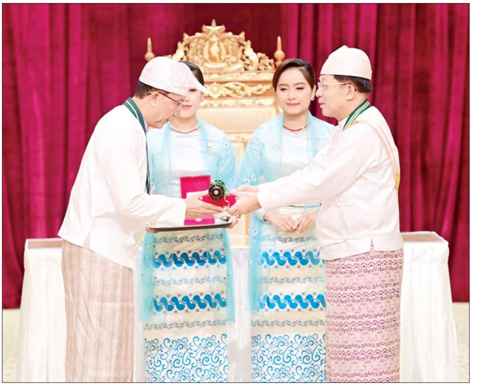
နိုင်ငံတော်စီမံအုပ်ချုပ်ရေးကောင်စီဥက္ကဋ္ဌ နိုင်ငံတော်ဝန်ကြီးချုပ် ဗိုလ်ချုပ်မှူးကြီး သတိုးမဟာသရေစည်သူ သတိုးသီရိသုဓမ္မ မင်းအောင်လှိုင် စည်သူဘွဲ့ရရှိသူ ဒုတိယဝန်ကြီးချုပ်နှင့် စီမံကိန်းနှင့် ဘဏ္ဍာရေးဝန်ကြီးဌာန ပြည်ထောင်စုဝန်ကြီး ဦးဝင်းရှိန်အား ဂုဏ်ထူးဆောင်ဘွဲ့ ချီးမြှင့်အပ်နှင်းစဉ်။

အားလုံးအသိပင်ဖြစ်ကြောင်း။ မိမိတို့၏ဘိုးဘေးအစဉ်အဆက် အသက်သွေးချွေး ရင်းနှီးပေးဆပ်ပြီး လက်ဆင့်ကမ်းခဲ့သည့် လွတ်လပ်ရေးအမွေကို ထာဝစဉ် တည်တံ့အောင် ထိန်းသိမ်းစောင့်ရှောက်ကြရမည့် တာဝန်သည် မိမိတို့အားလုံးအတွက် သမိုင်းပေးတာဝန်ပင်ဖြစ်ကြောင်း၊ တိုင်းပြည်၏ လွတ်လပ်ရေး အစဉ်တည်တံ့အောင် ထိန်းသိမ်းကာကွယ်စောင့်ရှောက်ရုံ သာမကဘဲ လွတ်လပ်ရေးအတွက် ကြိုးပမ်းဆောင်ရွက်ခဲ့ကြသူများ၏မျှော်မှန်းချက်များနှင့်အညီ အေးချမ်းသာယာပြီး ခေတ်မီဖွံ့ဖြိုးတိုးတက်သည့် နိုင်ငံတော်အဖြစ် တည်ဆောက်နိုင်ရေးကို လည်းအားကြိုးမာန်တက် ဆက်လက်ကြိုးပမ်းကြရမည် ဖြစ်ကြောင်း။ နိုင်ငံတော် စီမံအုပ်ချုပ်ရေးကောင်စီအနေဖြင့် တိုင်းရင်းသားပြည်သူများ၏ လူမှုစီးပွားဘဝစာမျက်နှာ ၄ သို့ »»