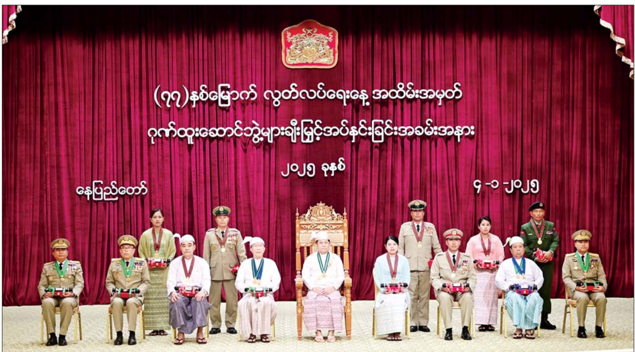
နိုင်ငံတော်စီမံအုပ်ချုပ်ရေးကောင်စီဥက္ကဋ္ဌ နိုင်ငံတော်ဝန်ကြီးချုပ် ဗိုလ်ချုပ်မှူးကြီး သတိုးမဟာသရေစည်သူ သတိုးသီရိသုဓမ္မ မင်းအောင်လှိုင် စည်သူဘွဲ့၊ သူရဘွဲ့၊ သီရိပျံချီဘွဲ့၊ ဇေယျကျော်ထင်ဘွဲ့ ရရှိကြသူများနှင့်အတူ စုပေါင်းမှတ်တမ်းတင် ဓာတ်ပုံရိုက်စဉ်။

အလိုက် အသေးစိတ်ဖော်ဆောင် ရမည့် လုပ်ငန်းတာဝန်များ များစွာ ရှိနေကြောင်း။ ထို့ကြောင့် အဆိုပါလုပ်ငန်း စဉ်အားလုံး အချိန်တိုအတွင်းတွင် ထိရောက် အောင်မြင်အောင် အကောင်အထည်ဖော် ဆောင် ရွက်နိုင်ရန်အတွက် ကဏ္ဍပေါင်းစုံ၊ ဘက်ပေါင်းစုံက အသိပညာရှင်၊ အတတ်ပညာရှင်များ၊ တိုင်းရင်း သားပြည်သူများက နိုင်ငံတော် အစိုးရနှင့် အတူတကွကြိုးကြိုး ပူးပေါင်း ဆောင်ရွက်ကြရန် အလေးအနက်တိုက်တွန်းမှာကြား လိုကြောင်း။ နိုင်ငံတော်အတွက် ထူးထူးချွန် ချွန်ဆောင်ရွက်ခဲ့ကြသူများ၊ စွန့် လွှတ်စွန့်စားမှု၊ အနစ်နာခံမှုတို့ဖြင့် တာဝန်ကျေခဲ့ကြသူများကို နိုင်ငံ တော်အစိုးရအနေဖြင့် ကျေးဇူး တင်ရှိသည်ကို ထပ်လောင်းပြော ကြားလိုကြောင်း၊ ယခုကဲ့သို့ ဂုဏ်ပြုချီးမြှင့်ပေးခြင်းကိုဝမ်းသာ ဂုဏ်ယူပါကြောင်းနှင့် ဆက်လက် ဤလည်း ဂုဏ်ပြုသင့်သူများကို မှတ်တမ်းတင် ဂုဏ်ပြုချီးမြှင့် သွားမည်ဖြစ်ကြောင်း ပြောကြား သည်။ ထို့နောက် နိုင်ငံတော်စီမံ အုပ်ချုပ်ရေးကောင်စီ ဥက္ကဋ္ဌ