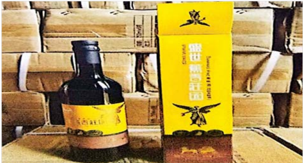
ကချင်ပြည်နယ်၌ သိမ်းဆည်းရမိမှု။

နေပြည်တော် ဇန်နဝါရီ ၄ တရားမဝင်ကုန်သွယ်မှုတိုက်ဖျက်ရေး ဦးဆောင်ကော်မတီ၏ ကြီးကြပ်ကွပ်ကဲမှုဖြင့် တရားမဝင်ကုန်သွယ်မှုများကို ဥပဒေနှင့်အညီ ထိရောက်စွာတားဆီးအရေးယူနိုင်ရေး ဆောင်ရွက်လျက်ရှိသည်။ ဇန်နဝါရီ ၂ ရက်တွင် အကောက်ခွန်ဦးစီးဌာန၏ စီမံခန့်ခွဲမှုဖြင့် တာဝန်ကျပူးပေါင်းအဖွဲ့က စစ်ဆေးမှုများဆောင်ရွက်ခဲ့ရာ မြန်မာ့စက်မှု ဆိပ်ကမ်း၌ ကုန်သေတ္တာသုံးလုံးအတွင်းမှ တရားဝင်စာရွက်စာတမ်း အထောက်အထားတင်ပြနိုင်ခြင်းမရှိသည့် လုပ်ငန်းသုံးပစ္စည်း နှစ်မျိုး စုစုပေါင်း (ခန့်မှန်းတန်ဖိုးငွေကျပ် ၉၁၆၈၆၄၂၀)ကို သိမ်းဆည်းရမိခဲ့ပြီး အကောက်ခွန်လုပ်ထုံးလုပ်နည်းများနှင့်အညီ အရေးယူဆောင်ရွက်လျက် ရှိသည်။ ထို့အပြင် ဇန်နဝါရီ ၃ ရက်တွင် ကချင်ပြည်နယ် တရားမဝင် ကုန်သွယ်မှုတိုက်ဖျက်ရေးအထူးအဖွဲ့၏ စီမံခန့်ခွဲမှုဖြင့် တာဝန်ကျ ပူးပေါင်းအဖွဲ့က စစ်ဆေးမှုများဆောင်ရွက်ခဲ့ရာ မြစ်ကြီးနားမြို့ မန်ခိန် ရပ်ကွက် စက်မှုဇုန်အကွက်အမှတ် (၆၂၊ ၆၃)၊ စက်မှုလမ်းသွယ်ရှိ ဂိုဒေါင် အတွင်းမှ တရားဝင်စာရွက်စာတမ်းအထောက်အထား တင်ပြနိုင်ခြင်း မရှိသည့် ယာဉ်အပိုပစ္စည်းတစ်မျိုး၊ စားသောက်ကုန်ပစ္စည်းတစ်မျိုး စုစုပေါင်း (ခန့်မှန်းတန်ဖိုးငွေကျပ် ၁၈၉၃၀၀၀၀)ကို သိမ်းဆည်းရမိခဲ့ပြီး အကောက်ခွန်လုပ်ထုံးလုပ်နည်းများနှင့်အညီ အရေးယူဆောင်ရွက် လျက်ရှိသည်။