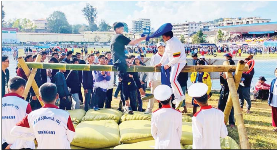
တောင်ကြီးမြို့၌ (၇၇) နှစ်မြောက် လွတ်လပ်ရေးနေ့ အထိမ်းအမှတ် အားကစားပြိုင်ပွဲများ ကျင်းပစဉ်။