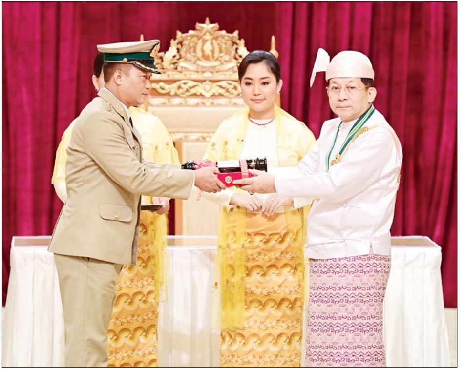
နိုင်ငံတော်စီမံအုပ်ချုပ်ရေးကောင်စီဥက္ကဋ္ဌ နိုင်ငံတော်ဝန်ကြီးချုပ် ဗိုလ်ချုပ်မှူးကြီး သတိုးမဟာသရေစည်သူ သတိုးသီရိသုဓမ္မ မင်းအောင်လှိုင် သူရဘွဲ့ရရှိသူ ကာကွယ်ရေးဝန်ကြီးဌာနမှ ဗိုလ်မှူးကြီး မျိုးကိုကိုထွန်းအတွက် ဂုဏ်ထူးဆောင်ဘွဲ့ချီးမြှင့်ရာ ဒုတိယဗိုလ်မှူးကြီး အောင်ဇော်ဝင်းက(ကိုယ်စား) လက်ခံစဉ်။