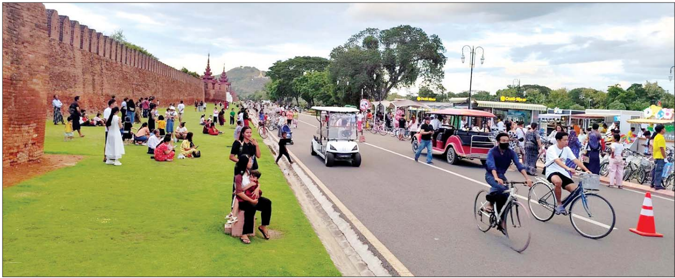
(၇၇) နှစ်မြောက် လွတ်လပ်ရေးနေ့တွင် မန္တလေးနန်းမြို့ရှိ ရတနာပုံဥယျာဉ်တွင် လာရောက်လည်ပတ်အပန်းဖြေသူများဖြင့် စည်ကားလျက်ရှိသည်ကို တွေ့ရစဉ်။

နေပြည်တော် ဇန်နဝါရီ ၄ ယနေ့သည် မြန်မာတစ်မျိုးသားလုံး ဝမ်းသာပျော်ရွှင်မဆုံးဖြစ်ရသော (၇၇)နှစ်မြောက် လွတ်လပ်ရေးနေ့ ဖြစ်သည်နှင့်အညီ လွတ်လပ်ရေးနေ့ အလံတင်အခမ်းအနားများ၊ အထိမ်းအမှတ် ပျော်ပွဲရွှင်ပွဲများနှင့် အားကစားပြိုင်ပွဲများကို မြန်မာနိုင်ငံအနှံ့အပြားရှိ တိုင်းဒေသကြီးနှင့် ပြည်နယ်အသီးသီးတွင် စည်ကားသိုက်မြိုက်စွာ ကျင်းပကြသည်။ ၎င်းအပြင် တန်ခိုးကြီးဘုရားစေတီများ၊ ပန်းခြံများ၊ အများနှင့် သက်ဆိုင်သောနေရာများ၌ ဘုရားဖူးမြော်သူများနှင့် လာရောက်အပန်းဖြေသူများဖြင့် စည်ကားလျက်ရှိသည်။ ထို့အပြင် နေပြည်တော်ကောင်စီနယ်မြေ၊ ရန်ကုန်၊ မန္တလေးမြို့ကြီးများ အပါအဝင် အခြားမြို့ကြီးများ၌ လွတ်လပ်ရေးနေ့ အထိမ်းအမှတ် ဂုဏ်ပြုမီးအလှထွန်းညှိခြင်းများ ဆောင်ရွက်ကြရာ လာရောက်ကြည့်ရှုသူ မိဘပြည်သူများဖြင့် စည်ကားများပြားလျက်ရှိကြောင်း သိရသည်။