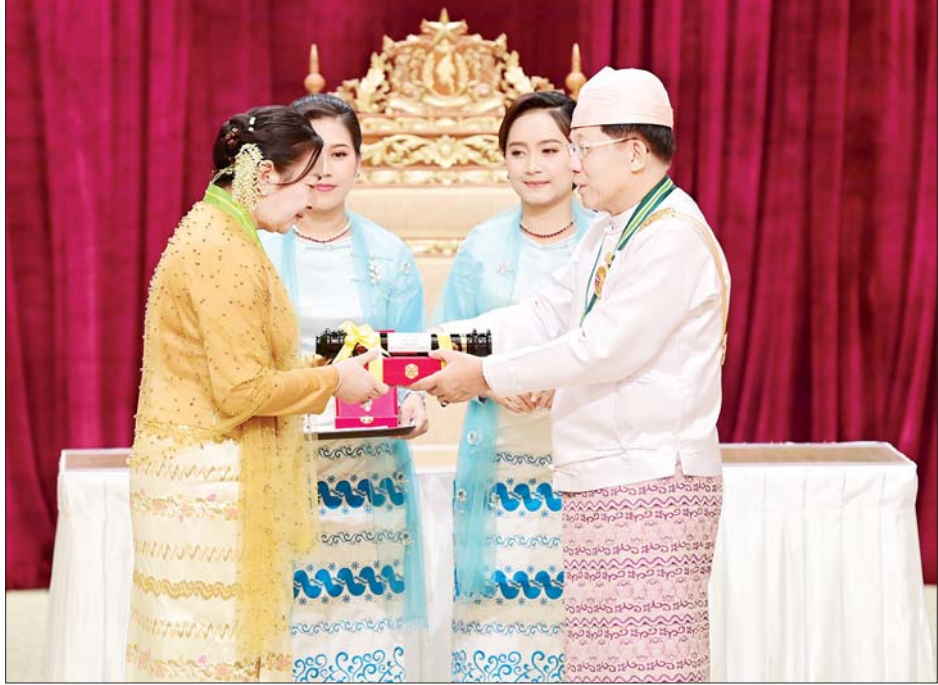
နိုင်ငံတော်စီမံအုပ်ချုပ်ရေးကောင်စီဥက္ကဋ္ဌ နိုင်ငံတော်ဝန်ကြီးချုပ် ဗိုလ်ချုပ်မှူးကြီး သတိုးမဟာ သရေစည်သူ သတိုးသီရိသုဓမ္မမင်းအောင်လှိုင် ဝဏ္ဏကျော်ထင်ဘွဲ့ ရရှိသူ ရင်းနှီးမြှုပ်နှံမှုနှင့် နိုင်ငံခြားစီးပွား ဆက်သွယ်ရေးဝန်ကြီးဌာန ဒုတိယဝန်ကြီး ဒေါက်တာဝါဝါမောင်အား ဂုဏ်ထူးဆောင်ဘွဲ့ ချီးမြှင့်အပ်နှင်းစဉ်။

နိုင်ငံတော်ဝန်ကြီးချုပ် ဗိုလ်ချုပ် မှူးကြီး သတိုးမဟာသရေစည်သူ သတိုးသီရိသုဓမ္မ မင်းအောင်လှိုင် က ပြည်ထောင်စု စည်သူသင်္ဂဟ ဘွဲ့များဖြစ်ကြသည့် စည်သူဘွဲ့၊ ရရှိ သူတစ်ဦး၊ တပ်မတော်စွမ်းရည် သတ္တိဆိုင်ရာဘွဲ့ဖြစ်သည့် သူရဘွဲ့၊ ရရှိသူ ရှစ်ဦး၊ စွမ်းဆောင်မှုဆိုင်ရာ ဂုဏ်ထူးဆောင်ဘွဲ့များ ဖြစ်ကြ သည့် သီရိပျံချီဘွဲ့၊ ရရှိသူ တစ်ဦး၊ ဇေယျကျော်ထင်ဘွဲ့၊ ရရှိသူ သုံးဦး၊ ဝဏ္ဏကျော်ထင်ဘွဲ့၊ ရရှိသူ ၇၈ ဦး၊ အလင်္ကာကျော်စွာဘွဲ့၊ ရရှိသူ သုံးဦး နှင့်သိပ္ပကျော်စွာဘွဲ့၊ ရရှိသူ နှစ်ဦး တို့ကို ဂုဏ်ထူးဆောင်ဘွဲ့များ တစ်ဦးချင်း လက်ရောက်ချီးမြှင့် အပ်နှင်းသည်။ ယင်းနောက် နိုင်ငံတော်စီမံ အုပ်ချုပ်ရေးကောင်စီဥက္ကဋ္ဌ နိုင်ငံ တော်ဝန်ကြီးချုပ်က ဂုဏ်ထူး ဆောင်ဘွဲ့ ရရှိသူများနှင့်အတူ မှတ်တမ်းတင်စုပေါင်း ဓာတ်ပုံရိုက် သည်။ အခမ်းအနားအပြီးတွင် နိုင်ငံ တော်စီမံအုပ်ချုပ်ရေးကောင်စီ ဥက္ကဋ္ဌ နိုင်ငံတော်ဝန်ကြီးချုပ် သည် အခမ်းအနားသို့ တက်ရောက်လာကြသူများ၊ ဂုဏ် ထူးဆောင်ဘွဲ့ ရရှိကြသူများနှင့် ၎င်းတို့၏ မိသားစုဝင်များကို ရင်းရင်းနှီးနှီး နှုတ်ဆက်ခဲ့ကြောင်း သိရသည်။ သတင်းစဉ်