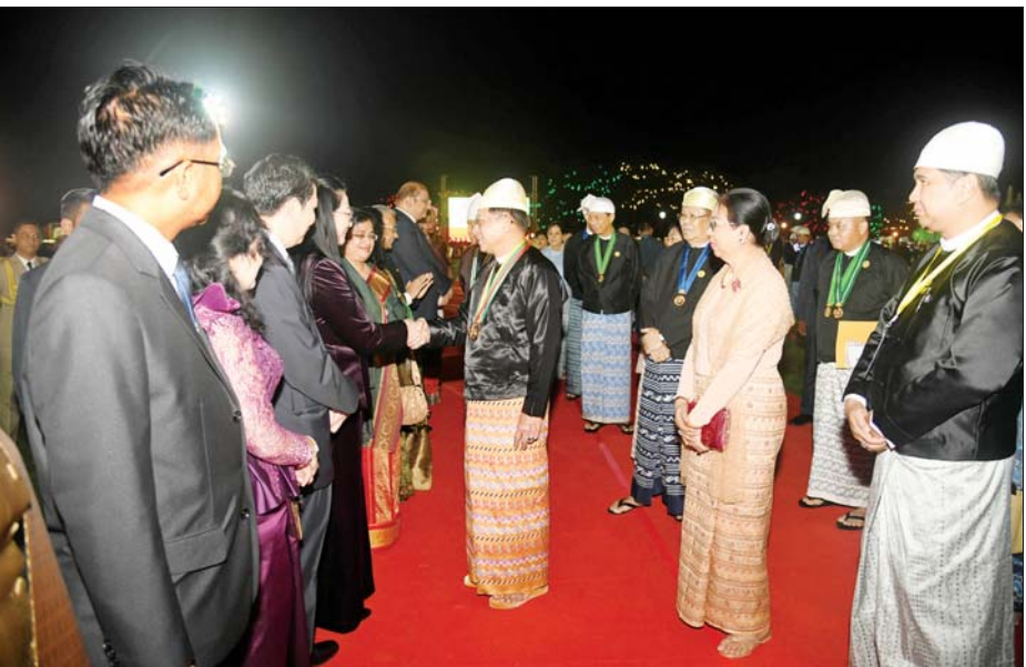
နိုင်ငံတော်စီမံအုပ်ချုပ်ရေးကောင်စီဥက္ကဋ္ဌ နိုင်ငံတော်ဝန်ကြီးချုပ် ဗိုလ်ချုပ်မှူးကြီး သတိုးမဟာ သရေစည်သူ သတိုးသီရိသုဓမ္မ မင်းအောင်လှိုင်နှင့် ဇနီး ဒေါ်ကြူကြူလှတို့က (၇၇)နှစ်မြောက် လွတ်လပ်ရေးနေ့ ဂုဏ်ပြုညစာစားပွဲအခမ်းအနားသို့ တက်ရောက်လာကြသူများအား ရင်းရင်းနှီးနှီး နှုတ်ဆက်စဉ်။

ကြသည့် နိုင်ငံရေးပါတီများမှ ဥက္ကဋ္ဌများနှင့် ကိုယ်စားလှယ်များ၊ နိုင်ငံခြားသံရုံးများမှ သံအမတ်ကြီး များနှင့် သံရုံးတာဝန်ခံများ၊ ဂုဏ်ထူးဆောင်ကောင်စစ်ဝန်များ နှင့် အထူးဖိတ်ကြားထားသည့် ဧည့်သည်တော်များကို ရင်းရင်း နှီးနှီး နှုတ်ဆက်သည်။ ယင်းနောက် နိုင်ငံတော်စီမံ အုပ်ချုပ်ရေးကောင်စီ ဥက္ကဋ္ဌ နိုင်ငံတော်ဝန်ကြီးချုပ်နှင့် ဇနီးတို့ သည် ဂုဏ်ပြုညစာစားပွဲအခမ်း အနားသို့ တက်ရောက်လာကြသူ များနှင့်အတူ မီးရှူးမီးပန်းများ ပစ်ဖောက်မှုကို ကြည့်ရှုအားပေး ကြသည်။ ဆက်လက်၍ နိုင်ငံတော် စီမံအုပ်ချုပ်ရေးကောင်စီ ဥက္ကဋ္ဌ နိုင်ငံတော်ဝန်ကြီးချုပ်နှင့် ဇနီးတို့ သည် ဂုဏ်ပြုညစာစားပွဲသို့ တက်ရောက်လာကြသူများနှင့် အတူညစာကို အတူတကွ သုံးဆောင်ကြသည်။ ညစာ မသုံး ဆောင်မီနှင့် သုံးဆောင်နေစဉ် အတွင်း စာမျက်နှာ ၉ သို့ ❖