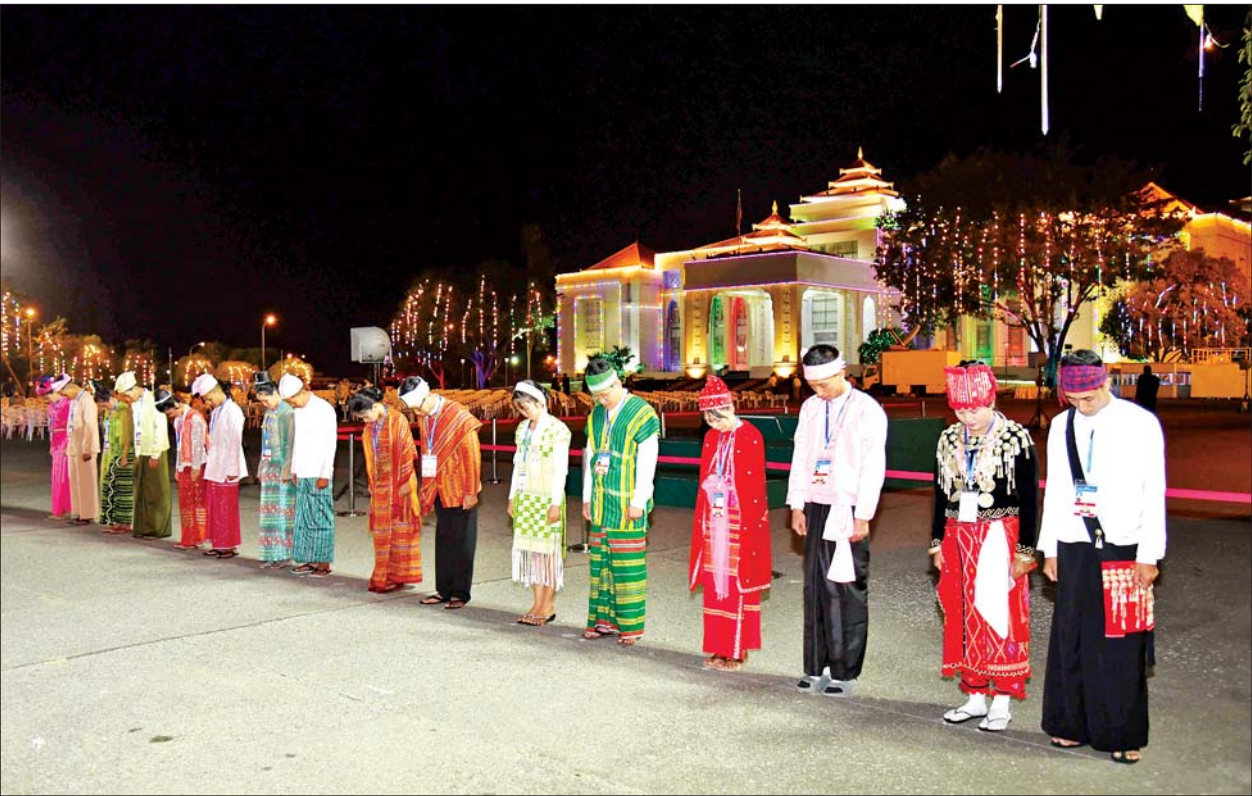
တိုင်းရင်းသား တိုင်းရင်းသူများက ပြည်ထောင်စုသမ္မတမြန်မာနိုင်ငံတော် အလံကို အလေးပြုကြစဉ်။

ဆက်လက်၍ (၇၇)နှစ်မြောက် လွတ်လပ်ရေးနေ့ ကျင်းပရေး ဗဟိုကော်မတီဥက္ကဋ္ဌ နိုင်ငံတော် စီမံအုပ်ချုပ်ရေးကောင်စီဒုတိယ ဥက္ကဋ္ဌ ဒုတိယဝန်ကြီးချုပ် ဒုတိယ ဗိုလ်ချုပ်မှူးကြီး သီရိပျံချီ မဟာ