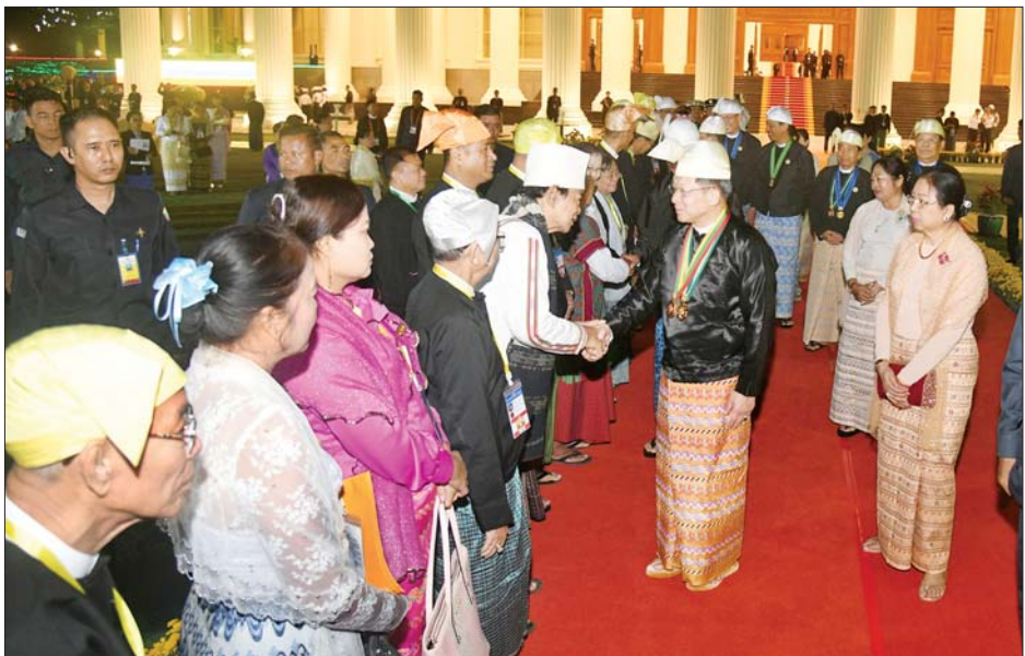
နိုင်ငံတော်စီမံအုပ်ချုပ်ရေးကောင်စီဥက္ကဋ္ဌ နိုင်ငံတော်ဝန်ကြီးချုပ် ဗိုလ်ချုပ်မှူးကြီး သတိုးမဟာ သရေစည်သူ သတိုးသီရိသုဓမ္မ မင်းအောင်လှိုင်နှင့် ဇနီး ဒေါ်ကြူကြူလှတို့က (၇၇)နှစ်မြောက် လွတ်လပ်ရေးနေ့ ဂုဏ်ပြုညစာစားပွဲအခမ်းအနားသို့ တက်ရောက်လာကြသူများအား ရင်းရင်းနှီးနှီး နှုတ်ဆက်စဉ်။