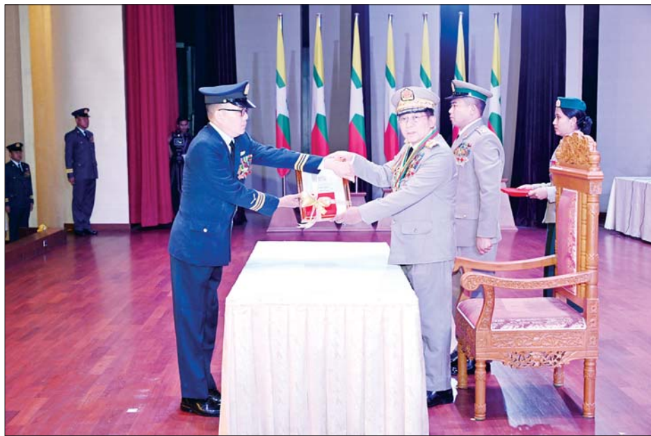
နိုင်ငံတော်စီမံအုပ်ချုပ်ရေးကောင်စီဥက္ကဋ္ဌ တပ်မတော်ကာကွယ်ရေးဦးစီးချုပ် ဗိုလ်ချုပ်မှူးကြီး သတိုးမဟာသရေစည်သူ သတိုးသီရိသူဓမ္မ မင်းအောင်လှိုင် သူရဲကောင်းမှတ်တမ်းဝင်တံဆိပ်ရရှိသူ ဗိုလ်မှူးဇာနည်ထွန်းအား ဆုတံဆိပ်ပေးအပ်ချီးမြှင့်စဉ်။

တစ်ဦး၊ တပ်ကြပ်ကြီး တစ်ဦး၊ တပ်ကြပ် သုံးဦး၊ ဒုတိယတပ်ကြပ် နှစ်ဦးတို့အား ဆုတံဆိပ်များ ပေးအပ်ချီးမြှင့်သည်။ ထို့နောက် နိုင်ငံတော်စီမံ အုပ်ချုပ်ရေးကောင်စီ ဥက္ကဋ္ဌ တပ်မတော်ကာကွယ်ရေး ဦးစီးချုပ် နှင့် အဖွဲ့ဝင်များသည် တပ်မတော် စွမ်းရည်သတ္တိဆိုင်ရာ ဂုဏ်ထူး ဆောင်တံဆိပ်များ ရရှိခဲ့သည့် အရာရှိ၊ စစ်သည်များ၊ အမွေခံများ နှင့်အတူ အမှတ်တရ စုပေါင်း ဓာတ်ပုံရိုက်ကြသည်။ ဆက်လက်၍ နိုင်ငံတော်စီမံ အုပ်ချုပ်ရေးကောင်စီ ဥက္ကဋ္ဌ တပ်မတော် ကာကွယ်ရေးဦးစီး ချုပ်နှင့် အဖွဲ့ဝင်များသည် တပ်မတော်စွမ်းရည်သတ္တိဆိုင်ရာ ဂုဏ်ထူးဆောင်တံဆိပ်များ ချီးမြှင့် ခံရသူများကို လက်ဖက်ရည်ဝိုင်း ဖြင့် တည်ခင်းဧည့်ခံခဲ့ပြီး ပြည်သူ့ ဆက်ဆံရေးနှင့် စိတ်ဓာတ်စစ်ဆင် ရေးညွှန်ကြားရေးမှူးရုံး ကွပ်ကဲမှု အောက် မြဝတီတေးဂီတအဖွဲ့က တေးသီချင်းများဖြင့် ဂုဏ်ပြု ဖျော်ဖြေကြသည်။ အခမ်းအနားအပြီးတွင် နိုင်ငံ တော် စီမံအုပ်ချုပ်ရေးကောင်စီ ဥက္ကဋ္ဌ တပ်မတော်ကာကွယ်ရေး ဦးစီးချုပ်နှင့် အဖွဲ့ဝင်များသည် တပ်မတော်စွမ်းရည်သတ္တိဆိုင်ရာ ဂုဏ်ထူးဆောင်တံဆိပ် ချီးမြှင့်ခံရ သူများကို ရင်းရင်းနှီးနှီးနှုတ်ဆက် ခဲ့ကြကြောင်း သိရသည်။ သတင်းစဉ်