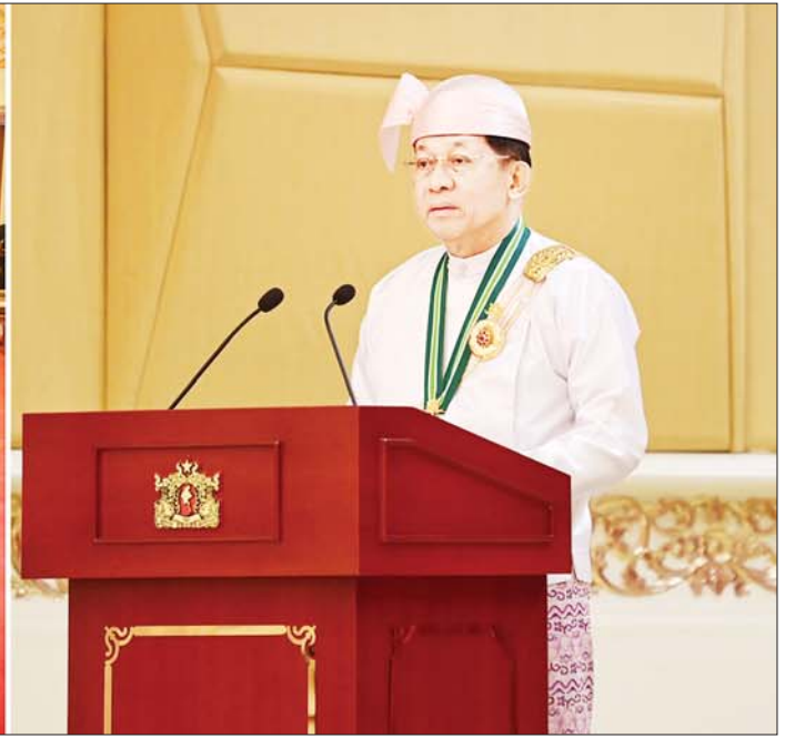
နိုင်ငံတော်စီမံအုပ်ချုပ်ရေးကောင်စီဥက္ကဋ္ဌ နိုင်ငံတော်ဝန်ကြီးချုပ် ဗိုလ်ချုပ်မှူးကြီး သတိုးမဟာသရေစည်သူ သတိုးသီရိသုဓမ္မ မင်းအောင်လှိုင် (၇၇) နှစ်မြောက် လွတ်လပ်ရေးနေ့အထိမ်းအမှတ် ဂုဏ်ထူးဆောင်ဘွဲ့များ ချီးမြှင့်အပ်နှင်းခြင်းအခမ်းအနားတွင် အမှာစကားပြောကြားစဉ်။