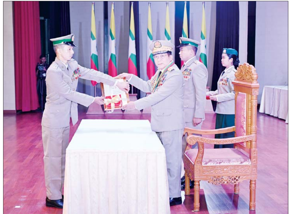
နိုင်ငံတော်စီမံအုပ်ချုပ်ရေးကောင်စီဥက္ကဋ္ဌ တပ်မတော်ကာကွယ်ရေးဦးစီးချုပ် ဗိုလ်ချုပ်မှူးကြီး သတိုးမဟာသရေစည်သူ သတိုးသီရိသုဓမ္မ မင်းအောင်လှိုင် သူရဲကောင်းမှတ်တမ်းဝင်တံဆိပ်ရရှိသူ ဗိုလ်မှူး ဇော်ဇော်အောင်အား ဆုတံဆိပ်ပေးအပ်ချီးမြှင့်စဉ်။