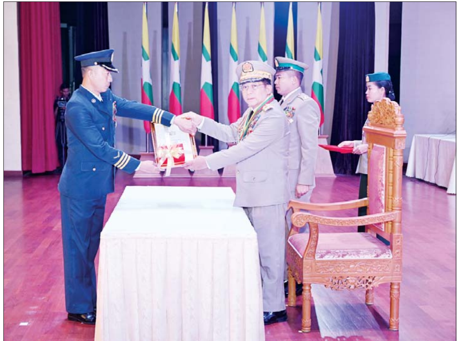
နိုင်ငံတော်စီမံအုပ်ချုပ်ရေးကောင်စီဥက္ကဋ္ဌ တပ်မတော်ကာကွယ်ရေးဦးစီးချုပ် ဗိုလ်ချုပ်မှူးကြီး သတိုးမဟာသရေစည်သူ သတိုးသီရိသုဓမ္မ မင်းအောင်လှိုင် သူရဲကောင်းမှတ်တမ်းဝင်တံဆိပ်ရရှိသူ ဒုတိယဗိုလ်မှူးကြီး သန့်ဇင်ဦးအား ဆုတံဆိပ်ပေးအပ်ချီးမြှင့်စဉ်။