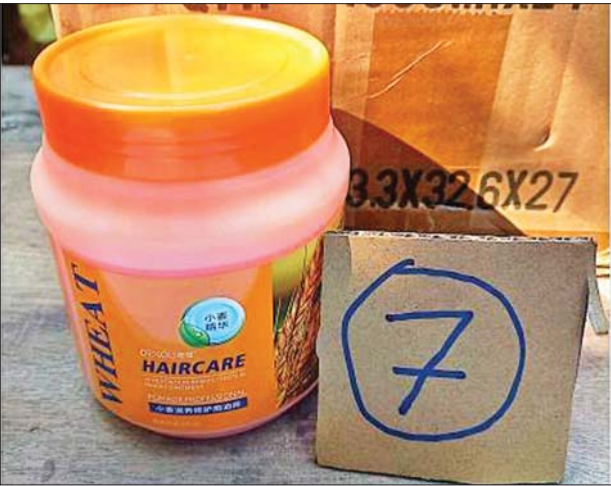
မန္တလေးတိုင်းဒေသကြီး၌ သိမ်းဆည်းရမိမှု။

ထို့အတူ စစ်ကိုင်းတိုင်းဒေသကြီး တရားမဝင်ကုန်သွယ်မှုတိုက်ဖျက် ရေးအထူးအဖွဲ့၏စီမံခန့်ခွဲမှုဖြင့် တာဝန်ကျပူးပေါင်းအဖွဲ့က စစ်ဆေးမှု များ ဆောင်ရွက်ခဲ့ရာ ကလေးမြို့နယ်၌ လိုင်စင်မဲ့ Honda Click 125 ဆိုင်ကယ်တစ်စီး (ခန့်မှန်းတန်ဖိုးငွေကျပ် ၁၀၀၀၀၀၀)ကို သိမ်းဆည်း ရမိခဲ့ပြီး ပို့ကုန်သွင်းကုန်ဥပဒေနှင့်အညီ အရေးယူဆောင်ရွက်လျက်ရှိ သည်။ ထို့အတူ မန္တလေးတိုင်းဒေသကြီး တရားမဝင်ကုန်သွယ်မှုတိုက်ဖျက် ရေးအထူးအဖွဲ့၏စီမံခန့်ခွဲမှုဖြင့် တာဝန်ကျပူးပေါင်းအဖွဲ့များက စစ်ဆေး မှုများဆောင်ရွက်ခဲ့ရာ ရတနာပုံတံတား (မန္တလေး) စစ်ဆေးရေးစခန်း၌ မန္တလေးမြို့မှ ဗုံရွာမြို့သို့ သွားရောက်မည့် ယာဉ်တစ်စီးပေါ်မှ တရားဝင် စာရွက်စာတမ်းအထောက်အထား တင်ပြနိုင်ခြင်းမရှိသည့် စားသောက် ကုန်ပစ္စည်းတစ်မျိုး (ခန့်မှန်းတန်ဖိုးငွေကျပ် ၈၃၉၈၈၀၀)နှင့် အဆိုပါ ပစ္စည်းများ တင်ဆောင်လာသည့် Toyota Toyoace Truck တစ်စီး (ခန့်မှန်းတန်ဖိုးငွေကျပ် ၁၅၀၀၀၀၀၀)ကိုလည်းကောင်း၊ စဉ့်ကိုင်ကတ္တား ဂိတ်အကျော်၌ ယာဉ်တစ်စီးပေါ်မှ တရားဝင်စာရွက်စာတမ်းအထောက် အထားတင်ပြနိုင်ခြင်းမရှိသည့် လူသုံးကုန်ပစ္စည်း ကိုးမျိုး (ခန့်မှန်းတန်ဖိုး ငွေကျပ် ၆၅၉၈၈၇၀၀)နှင့် အဆိုပါပစ္စည်းများ တင်ဆောင်လာသည့် Nissan UD Truck တစ်စီး (ခန့်မှန်းတန်ဖိုးငွေကျပ် ၄၂၀၀၀၀၀၀) ကို လည်းကောင်း၊ ရန်ကုန်-မန္တလေးအမြန်လမ်း မိုင်တိုင်အမှတ် (၃၆၆/၆) တံခွန်တိုင်အဝိုင်းအနီး၌ ယာဉ်တစ်စီးပေါ်မှ တရားဝင်စာရွက်စာတမ်း