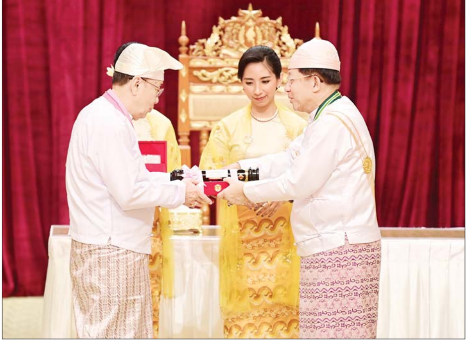
နိုင်ငံတော်စီမံအုပ်ချုပ်ရေးကောင်စီဥက္ကဋ္ဌ နိုင်ငံတော်ဝန်ကြီးချုပ် ဗိုလ်ချုပ်မှူးကြီး သတိုးမဟာ သရေစည်သူ သတိုးသီရိသုဓမ္မမင်းအောင်လှိုင် သိပ္ပကျော်စွာဘွဲ့ ရရှိသူ ကျန်းမာရေးဝန်ကြီးဌာနမှ မြန်မာ နိုင်ငံဆေးကောင်စီဥက္ကဋ္ဌ ပါမောက္ခဒေါက်တာခင်မောင်အေးအား ဂုဏ်ထူးဆောင်ဘွဲ့ ချီးမြှင့်အပ်နှင်းစဉ်။