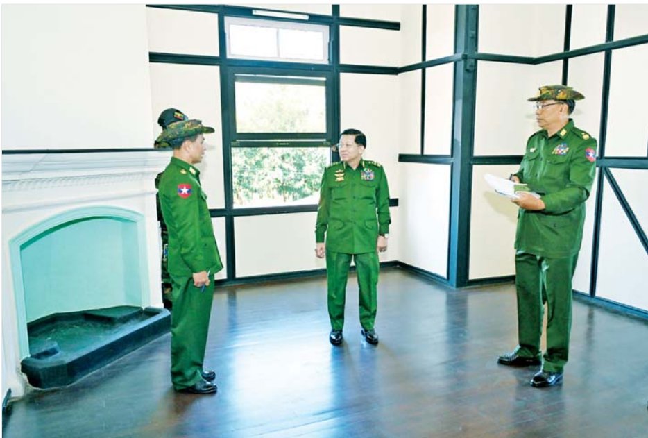
နိုင်ငံတော်စီမံအုပ်ချုပ်ရေးကောင်စီဥက္ကဋ္ဌ တပ်မတော်ကာကွယ်ရေးဦးစီးချုပ် ဗိုလ်ချုပ်မှူးကြီး မင်းအောင်လှိုင် ရှေးဟောင်းတပ်မတော်ဧည့်ရိပ်သာ သဇင်မြိုင်အား ထိန်းသိမ်းထားရှိမှု အခြေအနေများကို ကြည့်ရှုစစ်ဆေးစဉ်။

ထိန်းသိမ်းမှု ဆောင်ရွက်ရာတွင် ထည့်သွင်းအသုံးပြုရန် လိုအပ်သည့် ပရိဘောဂများနှင့် အခြားအသုံးအဆောင် ပစ္စည်းများကို ရှေးဟောင်းလက်ရာ ပစ္စည်းများကိုသာ အတတ်နိုင်ဆုံး ရှာဖွေထည့်သွင်းသုံးစွဲရန် လိုအပ်သည့် အခြေအနေများနှင့် ပတ်သက်၍ တာဝန်ရှိသူများအား မှာကြားပြီး ဧည့်ရိပ်သာများ၏ အတွင်းပိုင်းနှင့် အပြင်ပတ်ဝန်းကျင်ထိန်းသိမ်းထားရှိမှုတို့ကို လှည့်လည်ကြည့်ရှုစစ်ဆေးသည်။ ထို့ပြင် ပြင်ဦးလွင်မြို့ရှိ အခြားရှေးဟောင်းအဆောက်အအုံများကိုလည်း စနစ်တကျ ထိန်းသိမ်းစောင့်ရှောက်နိုင်ရေး ဆောင်ရွက်သွားရန် အတွက်တာဝန်ရှိသူများအား လိုအပ်သည်များ လမ်းညွှန်မှာကြားခဲ့ကြောင်း သိရသည်။ သတင်းစဉ်