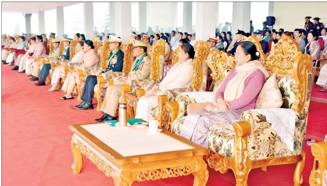
တပ်မတော်နည်းပညာတက္ကသိုလ် ဗိုလ်လောင်းသင်တန်းအမှတ်စဉ် (၂၆) သင်တန်းဆင်း ဂုဏ်ပြုစစ်ရေးပြအခမ်းအနားသို့ တက်ရောက်လာကြသူများကို တွေ့ရစဉ်။

ကျေးဇူးပြုစောင့်ရှောက်ခဲ့သည့် မိဘများ၏ကျေးဇူးကို သိတတ်ရန်နှင့် ကျေးဇူးဆပ်ရန်လိုအပ်သကဲ့သို့တပ်မတော် အပေါ်တွင်လည်း ကျေးဇူးသစ္စာစောင့်သိရ မည်ဖြစ်ကြောင်း၊ မိမိတို့၏ ရည်မှန်းချက် များ အောင်မြင်ရေး၊ မိသားစုများ၏ ရည်မှန်းချက်များ မပျောက်စေရေး အတွက် စစ်သားကောင်းတစ်ယောက် ဝိသစ္စာဖြင့် ဘဝတစ်လျှောက်လုံး ဆက်လက်ကြိုးစား ဆောင်ရွက်သွားရမည် ဖြစ်ကြောင်းနှင့် မိမိကိုယ်ကို ထိန်းထိန်း သိမ်းသိမ်းနေထိုင်ပြီး မိသားစု၊ တပ်မတော် နှင့်နိုင်ငံတော်အတွက်အားကိုးအားထားရ သည့်ခေါင်းဆောင်ကောင်းများဖြစ်အောင် စဉ်ဆက်မပြတ် ကြိုးပမ်းဆောင်ရွက်သွား ရမည်ဖြစ်ကြောင်း မှာကြားခဲ့ကြောင်း သိရသည်။ သတင်းစဉ်