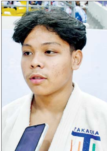
မောင်အဂ္ဂပိုင်ဇေ