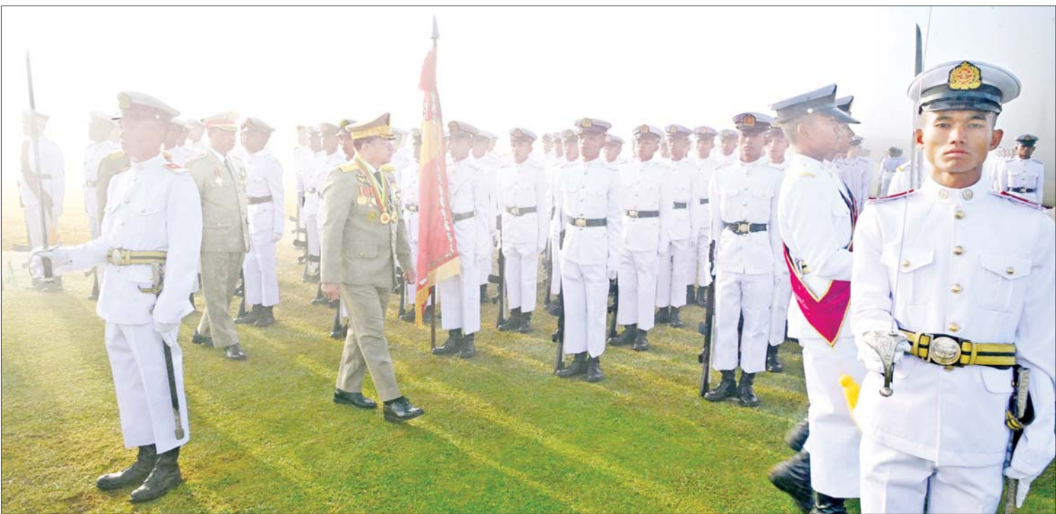
နိုင်ငံတော်စီမံအုပ်ချုပ်ရေးကောင်စီဥက္ကဋ္ဌ တပ်မတော်ကာကွယ်ရေးဦးစီးချုပ် ဗိုလ်ချုပ်မှူးကြီး သတိုးမဟာသရေစည်သူ သတိုးသီရိသုဓမ္မ မင်းအောင်လှိုင် ကျောင်းဆင်းဗိုလ်လောင်းတပ်ခွဲအား စစ်ဆေးစဉ်။

ထိုသို့ ပြောင်းလဲတိုးတက်နေသည့် စစ်မှုသိပ္ပံနှင့် နည်းပညာရပ်များကို သိရှိနားလည် အဓိလိုက်နိုင်ရန်အတွက်