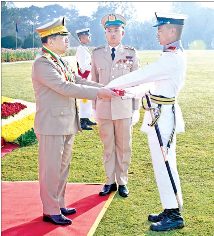
နိုင်ငံတော်စီမံအုပ်ချုပ်ရေးကောင်စီဥက္ကဋ္ဌ တပ်မတော်ကာကွယ်ရေးဦးစီးချုပ် ဗိုလ်ချုပ်မှူးကြီး သတိုးမဟာသရေစည်သူ သတိုးသီရိသုဓမ္မ မင်းအောင်လှိုင် တပ်မတော်နည်းပညာတက္ကသိုလ် ဗိုလ်လောင်းသင်တန်းအမှတ်စဉ်(၂၆)မှ လေ့ကျင့်ရေးထူးချွန်ဆုရရှိသူ ဗိုလ်လောင်းအမှတ် ၈၄၃၄ ဗိုလ်လောင်းသန်းထိုက်အောင်အား ဆုပေးအပ်ချီးမြှင့်စဉ်။