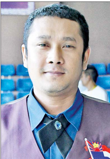
ကိုဇေယျာမင်း