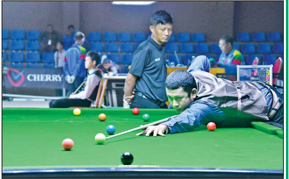
ပြည်နယ်နှင့် တိုင်းဒေသကြီး အမျိုးသား စနုကာပြိုင်ပွဲတွင် ပြိုင်ပွဲဝင်တစ်ဦး ယှဉ်ပြိုင်နေစဉ်။