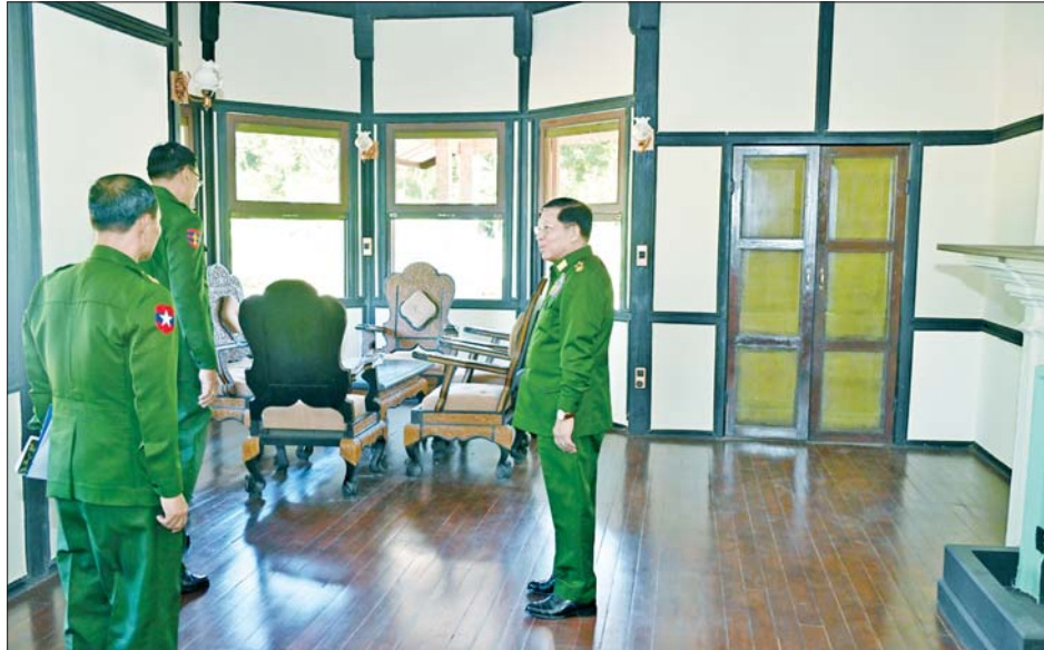
နိုင်ငံတော်စီမံအုပ်ချုပ်ရေးကောင်စီဥက္ကဋ္ဌ တပ်မတော်ကာကွယ်ရေးဦးစီးချုပ် ဗိုလ်ချုပ်မှူးကြီး မင်းအောင်လှိုင် ရှေးဟောင်းတပ်မတော်ညွှတ်ရိပ်သာ ယုဇနမြိုင်အား ထိန်းသိမ်းထားရှိမှု အခြေအနေ များကို ကြည့်ရှုစစ်ဆေးစဉ်။