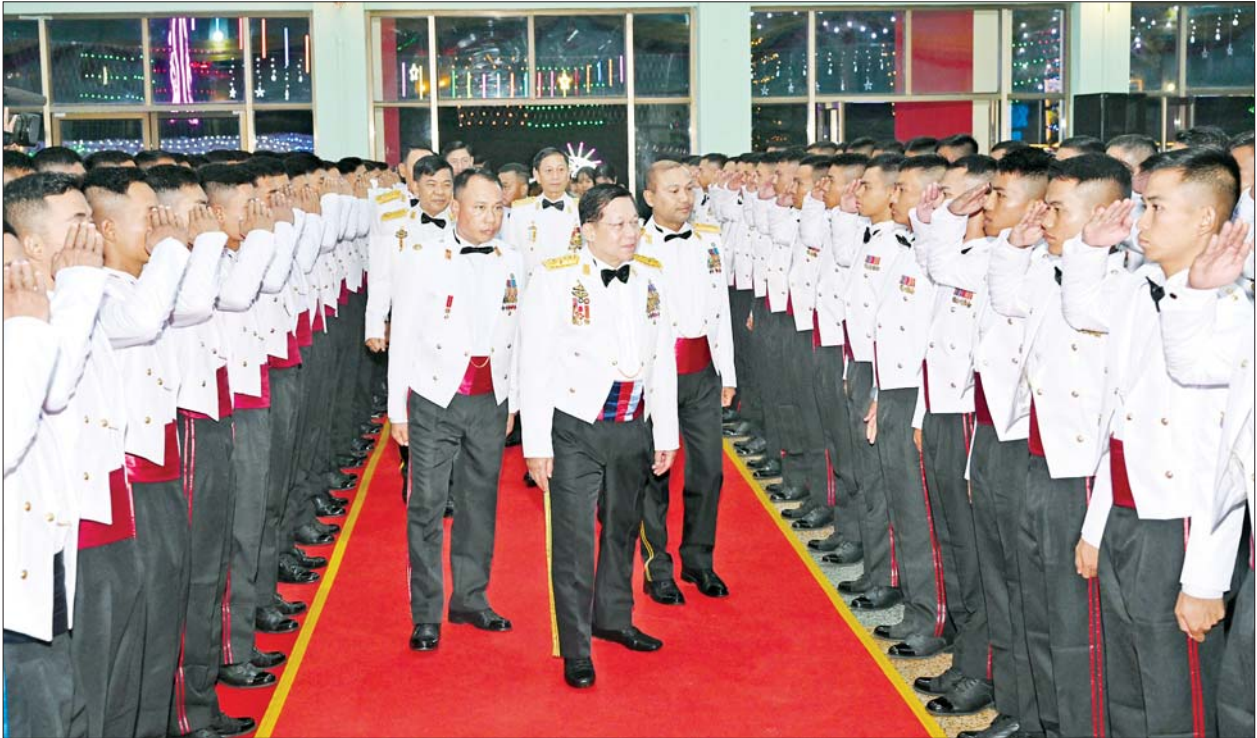
နိုင်ငံတော်စီမံအုပ်ချုပ်ရေးကောင်စီဥက္ကဋ္ဌ တပ်မတော်ကာကွယ်ရေးဦးစီးချုပ် ဗိုလ်ချုပ်မှူးကြီးမင်းအောင်လှိုင် သင်တန်းဆင်းအရာရှိများအား ရင်းရင်းနှီးနှီးနှုတ်ဆက်စဉ်။

နေပြည်တော် ဒီဇင်ဘာ ၁၂ တပ်မတော် နည်းပညာ တက္ကသိုလ် ဗိုလ်လောင်းသင်တန်း အမှတ်စဉ်(၂၆) သင်တန်းဆင်း ဂုဏ်ပြုညစာစားပွဲအခမ်းအနား ကို ယနေ့ညနေပိုင်းတွင် ပြင်ဦးလွင်မြို့ တပ်မတော် နည်းပညာ တက္ကသိုလ် ဗိုလ်လောင်းစားရိပ်သာ၌ ကျင်းပပြုလုပ်ရာ နိုင်ငံတော် စီမံအုပ်ချုပ်ရေးကောင်စီဥက္ကဋ္ဌ တပ်မတော်ကာကွယ်ရေး ဦးစီးချုပ် ဗိုလ်ချုပ်မှူးကြီးမင်းအောင်လှိုင် တက်ရောက်ချီးမြှင့်သည်။ အဆိုပါသင်တန်းဆင်းဂုဏ်ပြု ညစာစားပွဲအခမ်းအနားသို့ နိုင်ငံတော်စီမံအုပ်ချုပ်ရေး ကောင်စီဥက္ကဋ္ဌ တပ်မတော်ကာကွယ်ရေး ဦးစီးချုပ်နှင့်အတူ ဇနီး ဒေါ်ကြူကြူလှ၊ ညွှန်ကြားကွပ်ကဲရေးမှူး (ကြည်း၊ ရေ၊ လေ) ဗိုလ်ချုပ်ကြီး မောင်မောင်အေးနှင့် ဇနီး၊ ကာကွယ်ရေးဦးစီးချုပ် (ရေ) ဗိုလ်ချုပ်ကြီး ထိန်ဝင်းနှင့်ဇနီး၊ ကာကွယ်ရေး ဦးစီးချုပ်(လေ) ဗိုလ်ချုပ်ကြီး ထွန်းအောင်နှင့်ဇနီး၊ ကာကွယ်ရေးဦးစီးချုပ်ရုံးမှ အဆင့်မြင့်တပ်မတော်အရာရှိကြီးများ