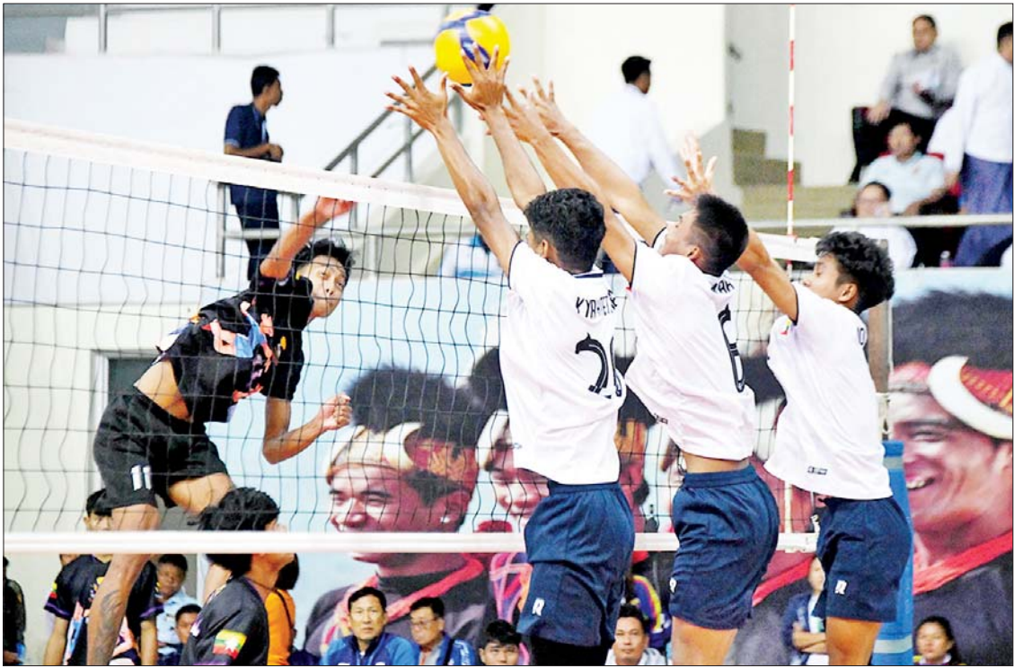
ပြည်နယ်နှင့်တိုင်းဒေသကြီး အမျိုးသားဘော်လီဘောပြိုင်ပွဲတွင် မန္တလေးတိုင်းဒေသကြီးနှင့် ရှမ်းပြည်နယ်အသင်းတို့ ယှဉ်ပြိုင်ကစားကြစဉ်။

ပြည်နယ်နှင့်တိုင်းဒေသကြီး ဗိုလ်ချုပ် ပြိုင်ပွဲကို ရွှေကြာပင်အားကစားရုံ၌