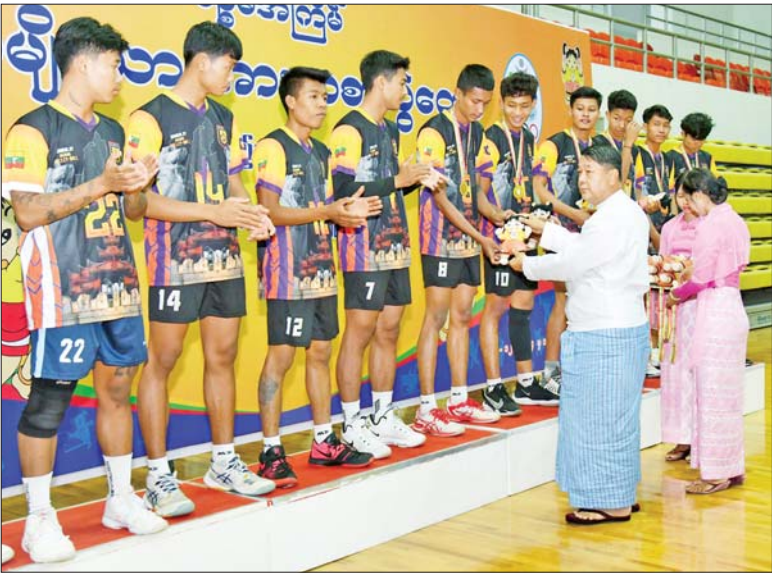
ပြည်ထောင်စု တရားလွှတ်တော်ချုပ် ပြည်ထောင်စုတရားသူကြီးချုပ် ဦးသာဌေး ပြည်နယ်နှင့် တိုင်းဒေသကြီးအဆင့် အမျိုးသား ဘော်လီဘောပြိုင်ပွဲတွင် ပထမဆုရရှိသည့် မန္တလေးတိုင်းဒေသကြီးအသင်းမှ ပြိုင်ပွဲဝင်များအား ဆုပေးအပ်ချီးမြှင့်စဉ်။

ပေးအပ်ချီးမြှင့် ယင်းနောက် စက်မှုဝန်ကြီးဌာန ဒုတိယဝန်ကြီး ဦးရင်မောင်ညွန့်က အမျိုးသား မိတာ ၄၀၀ တန်းကျော် ပြိုင်ပွဲတွင် ပထမဆုရရှိသည့် စစ်ကိုင်းတိုင်းဒေသကြီး၊ ဒုတိယဆုရရှိသည့် မန္တလေးတိုင်းဒေသကြီးနှင့် တတိယဆုရရှိသည့် တနင်္သာရီတိုင်းဒေသကြီး တို့မှ ပြိုင်ပွဲဝင်များအား လည်းကောင်း၊ စွမ်းအင်ဝန်ကြီးဌာန ဒုတိယဝန်ကြီး ဦးသန့်စင်က အမျိုးသမီး သံလုံးပစ်ပြိုင်ပွဲတွင် ပထမဆုရရှိသည့် ရှမ်းပြည်နယ်၊ ဒုတိယဆုရရှိသည့် ရခိုင်ပြည်နယ်နှင့် တတိယဆုရရှိသည့် စစ်ကိုင်းတိုင်းဒေသကြီးတို့မှ ပြိုင်ပွဲဝင်များအားလည်းကောင်း ဂုဏ်ပြုဆုတံဆိပ်နှင့် အမျိုးသား အားကစားပွဲတော် အထိမ်းအမှတ် အရုပ်များကို ပေးအပ်ချီးမြှင့်ကြသည်။ ဆက်လက်၍ နိုင်ငံတော်စီမံ