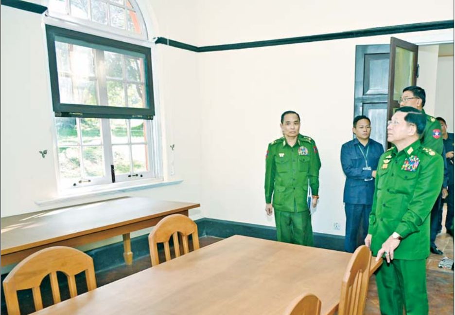
နိုင်ငံတော်စီမံအုပ်ချုပ်ရေးကောင်စီဥက္ကဋ္ဌ တပ်မတော်ကာကွယ်ရေးဦးစီးချုပ် ဗိုလ်ချုပ်မှူးကြီး မင်းအောင်လှိုင် ရှေးဟောင်းတပ်မတော်ညွှတ်ရိပ်သာ ချယ်ရီမြိုင်အား ထိန်းသိမ်းထားရှိမှု အခြေအနေများကို ကြည့်ရှုစစ်ဆေးစဉ်။