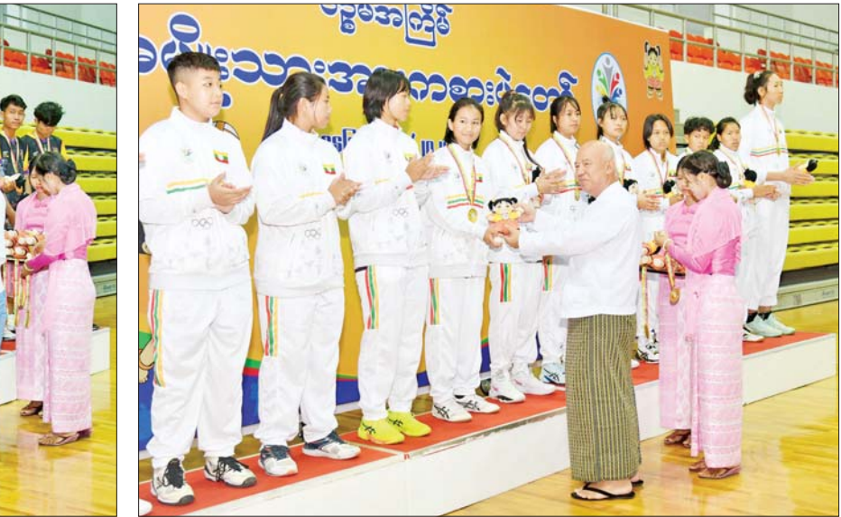
နိုင်ငံတော်ဖွဲ့စည်းပုံအခြေခံဥပဒေဆိုင်ရာ ခုံရုံးဥက္ကဋ္ဌ ဦးအောင်ဇော်သိန်း ပြည်နယ်နှင့် တိုင်းဒေသကြီးအဆင့် အမျိုးသမီး ဘော်လီဘောပြိုင်ပွဲတွင် ပထမဆုရရှိသည့် ရှမ်းပြည်နယ်အသင်းမှ ပြိုင်ပွဲဝင်များအား ဆုပေးအပ်ချီးမြှင့်စဉ်။

ရှိသူများ၊ ပြိုင်ပွဲဝင်အသင်းများမှ အုပ်ချုပ်သူ၊ နည်းပြများနှင့် အားကစားသမားများ တက်ရောက်ကြည့်ရှုအားပေးကြသည်။ ထို့နောက် ဆုချီးမြှင့်ပွဲအခမ်းအနားကို ဆက်လက်ကျင်းပရာ ညွှန်ကြားရေးမှူးချုပ် ဦးထွန်းမြင့် ဦးက အမျိုးသမီးဘော်လီဘော ပြိုင်ပွဲတွင် ပူးတွဲတတိယဆုရရှိသည့် ကချင်ပြည်နယ်အသင်းကို လည်းကောင်း၊ ဆောက်လုပ်ရေးဝန်ကြီးဌာန ဒုတိယဝန်ကြီး ဦးဝင်းဖေက ပူးတွဲတတိယဆုရရှိသည့် မန္တလေးတိုင်းဒေသကြီးအသင်းကိုလည်းကောင်း၊ လူဝင်မှုကြီးကြပ်ရေးနှင့် ပြည်သူ့အင်အားဝန်ကြီးဌာန ဒုတိယဝန်ကြီး ဒေါက်တာမျိုးသန့်က ဒုတိယဆုရရှိသည့် တနင်္သာရီတိုင်းဒေသကြီးအသင်းကိုလည်းကောင်း၊ နိုင်ငံတော်ဖွဲ့စည်းပုံ အခြေခံဥပဒေဆိုင်ရာ ခုံရုံးဥက္ကဋ္ဌ ဦးအောင်ဇော်သိန်းက ပထမဆုရရှိသည့် ရှမ်းပြည်နယ်အသင်းကိုလည်းကောင်း တစ်ဦးချင်းဂုဏ်ပြုဆုတံဆိပ်နှင့် အမျိုးသား အားကစားပွဲတော် အထိမ်းအမှတ် အရုပ်များကို ပေးအပ်ချီးမြှင့်ကြသည်။