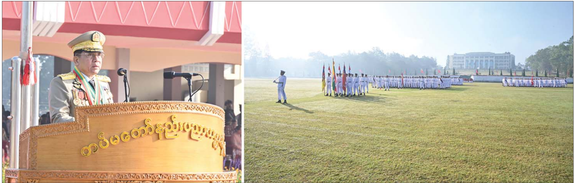
နိုင်ငံတော်စီမံအုပ်ချုပ်ရေးကောင်စီဥက္ကဋ္ဌ တပ်မတော်ကာကွယ်ရေးဦးစီးချုပ် ဗိုလ်ချုပ်မှူးကြီး သတိုးမဟာသရေစည်သူ သတိုးသီရိသုဓမ္မ မင်းအောင်လှိုင် တပ်မတော်နည်းပညာတက္ကသိုလ် ဗိုလ်လောင်း သင်တန်းအမှတ်စဉ်(၂၆) သင်တန်းဆင်းဂုဏ်ပြုစစ်ရေးပြ အခမ်းအနားတွင် မိန့်ခွန်းပြောကြားစဉ်။

( ၃-၉-၂၀၂၄ ရက်နေ့တွင် နိုင်ငံတော်စီမံအုပ်ချုပ်ရေးကောင်စီဥက္ကဋ္ဌ နိုင်ငံတော် ဝန်ကြီးချုပ် ဗိုလ်ချုပ်မှူးကြီး မင်းအောင်လှိုင် ရှမ်းပြည်နယ် အစိုးရအဖွဲ့ဝင်များ၊ ပြည်နယ်နှင့် ခရိုင်အဆင့် ဌာနဆိုင်ရာတာဝန်ရှိသူများအား ပြောကြားသည့် အမှာ စကားမှ ကောက်နုတ်ချက် )