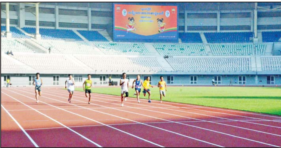
ပြည်နယ်နှင့် တိုင်းဒေသကြီး အမျိုးသား မီတာ ၂၀၀ အပြေးပြိုင်ပွဲတွင် ပြိုင်ပွဲဝင်များ ယှဉ်ပြိုင်စဉ်။