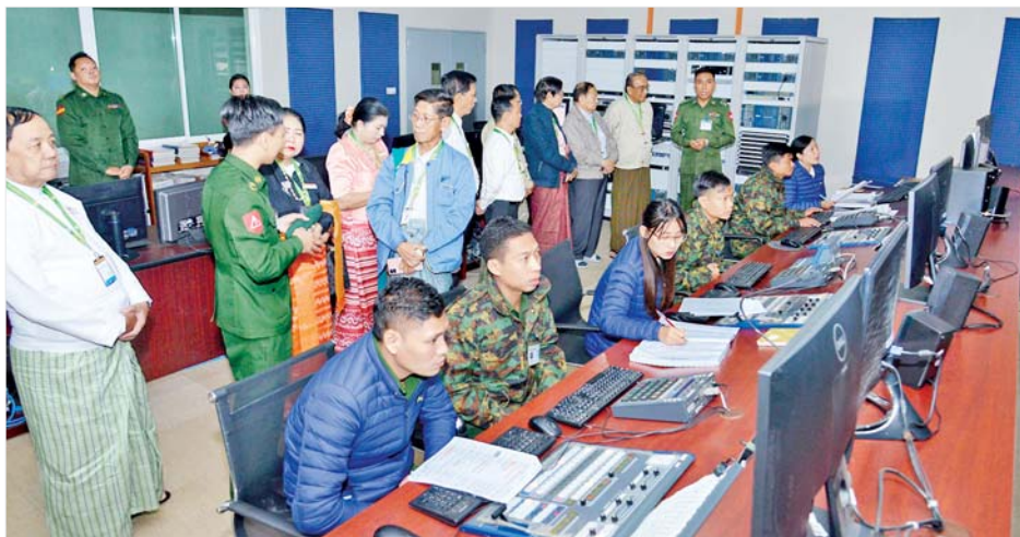
Song” ဖြင့် ဧည့်ခံတင်ဆက်မှုနှင့် “Channel Profile” ပြသမှုတို့ကို ကြည့်ရှုကြသည်။ (နေပြည်တော်)တပ်မှူးက ကြိုဆိုနှုတ်ခွန်းဆက်စကား ပြောကြား

နေပြည်တော် ဒီဇင်ဘာ ၁၂ မြန်မာနိုင်ငံ သတင်းမီဒီယာကောင်စီဥက္ကဋ္ဌ ဒေါက်တာ တင်ထွန်းဦး ဦးဆောင်သော မြန်မာနိုင်ငံ သတင်းမီဒီယာကောင်စီအဖွဲ့သည် ယနေ့နံနက်ပိုင်းတွင် မြဝတီရုပ်မြင်သံကြား (နေပြည်တော်)သို့ သွားရောက် လေ့လာကြရာ တပ်မှူးနှင့် တာဝန်ရှိသူများက ကြိုဆိုနှုတ်ဆက်ကြသည်။ ဦးစွာ လေ့လာရေးအဖွဲ့သည် ပင်မအဆောက်အအုံရှိ Production Theatre ခန်းမတွင် မြဝတီရုပ်မြင်သံကြား “ MWD Variety Theme