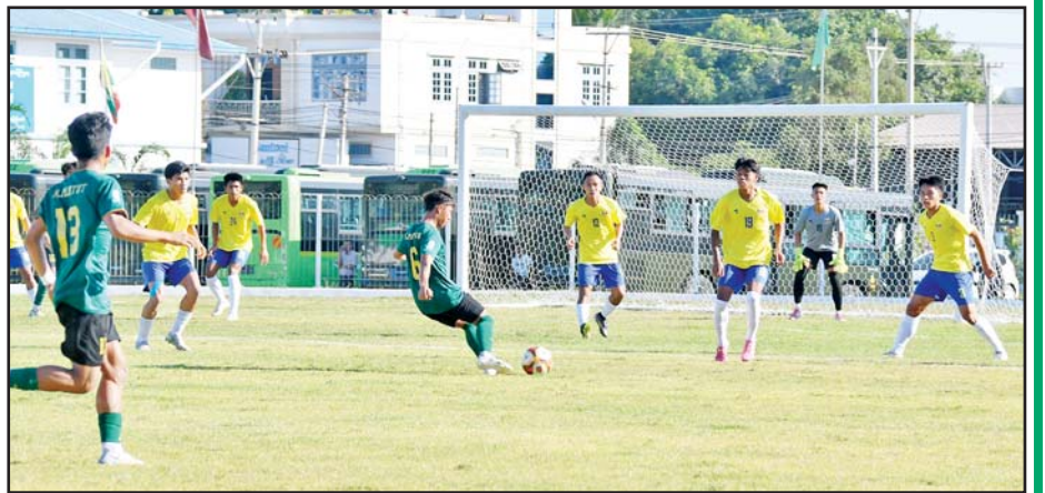
ဝန်ကြီးဌာနပေါင်းစုံ အလွတ်တန်း အမျိုးသားဘောလုံးပြိုင်ပွဲတွင် အားကစားနှင့် လူငယ်ရေးရာ ဝန်ကြီးဌာနအသင်းနှင့် သယံဇာတနှင့် သဘာဝပတ်ဝန်းကျင်ထိန်းသိမ်းရေးဝန်ကြီးဌာနအသင်းတို့ ယှဉ်ပြိုင်ကစားကြစဉ်။