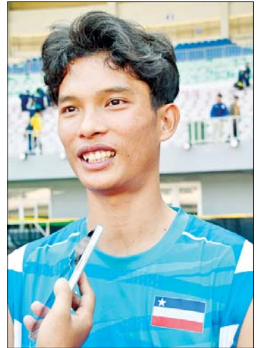
မောင်ညီညီထွန်း