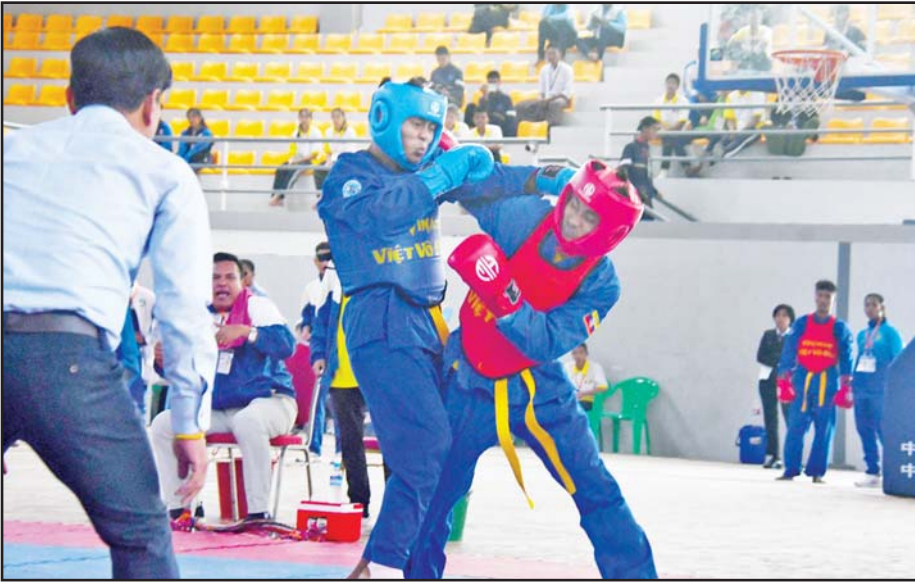
ပြည်နယ်နှင့် တိုင်းဒေသကြီး အမျိုးသား ဗိုလ်ချုပ်ပြိုင်ပွဲတွင် နေပြည်တော်ကောင်စီနယ်မြေနှင့် စစ်ကိုင်းတိုင်းဒေသကြီးတို့မှ ပြိုင်ပွဲဝင်များ ယှဉ်ပြိုင်စဉ်။