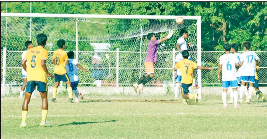
ပြည်နယ်နှင့် တိုင်းဒေသကြီး အမျိုးသားဘောလုံးပြိုင်ပွဲတွင် ရန်ကုန်တိုင်းဒေသကြီးနှင့် ချင်းပြည်နယ် အသင်းတို့ ယှဉ်ပြိုင်ကစားကြစဉ်။