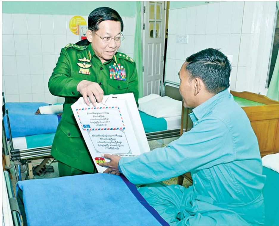
နိုင်ငံတော်စီမံအုပ်ချုပ်ရေးကောင်စီဥက္ကဋ္ဌ တပ်မတော်ကာကွယ်ရေးဦးစီးချုပ် ဗိုလ်ချုပ်မှူးကြီး မင်းအောင်လှိုင် ဆေးရုံတက်ရောက်ကုသမှုခံယူလျက်ရှိသူတစ်ဦးအား ဂုဏ်ပြုချီးမြှင့်ငွေနှင့် စားသောက် ဖွယ်ရာပစ္စည်းများ ပေးအပ်စဉ်။

နိုင်ငံတော် စီမံအုပ်ချုပ်ရေး ကောင်စီဥက္ကဋ္ဌ တပ်မတော် ကာကွယ်ရေး ဦးစီးချုပ် ဗိုလ်ချုပ်မှူးကြီး မင်းအောင်လှိုင် ပြင်ဦးလွင်မြို့ရှိ နယ်မြေခံ တပ်မတော် ဆေးရုံ၌ တက်ရောက်ကုသမှုခံယူလျက် ရှိသည့် နိုင်ငံတော်ကာကွယ် ရေးနှင့် လုံခြုံရေးတာဝန်များ ထမ်းဆောင်စဉ် ထိခိုက်ဒဏ်ရာ ရရှိခဲ့သူတစ်ဦးအား ထိခိုက် ဒဏ်ရာရရှိခဲ့မှု အခြေအနေအား မေးမြန်းပြီး အားပေးစကား ပြောကြားစဉ်။