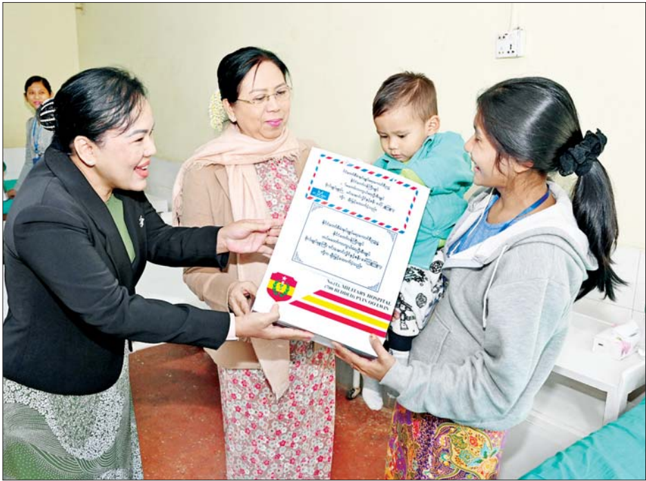
နိုင်ငံတော်စီမံအုပ်ချုပ်ရေးကောင်စီဥက္ကဋ္ဌ တပ်မတော်ကာကွယ်ရေးဦးစီးချုပ် ဗိုလ်ချုပ်မှူးကြီး မင်းအောင်လှိုင်၏ဇနီး ဒေါ်ကြူကြူလှ သားဖွားမီးယပ်နှင့် ကလေးကုသဆောင်၌ တက်ရောက်ကုသမှုခံယူ လျက်ရှိသည့် တပ်မတော်သား မိသားစုဝင်တစ်ဦးအား လက်ဆောင်ပစ္စည်းများ ပေးအပ်စဉ်။