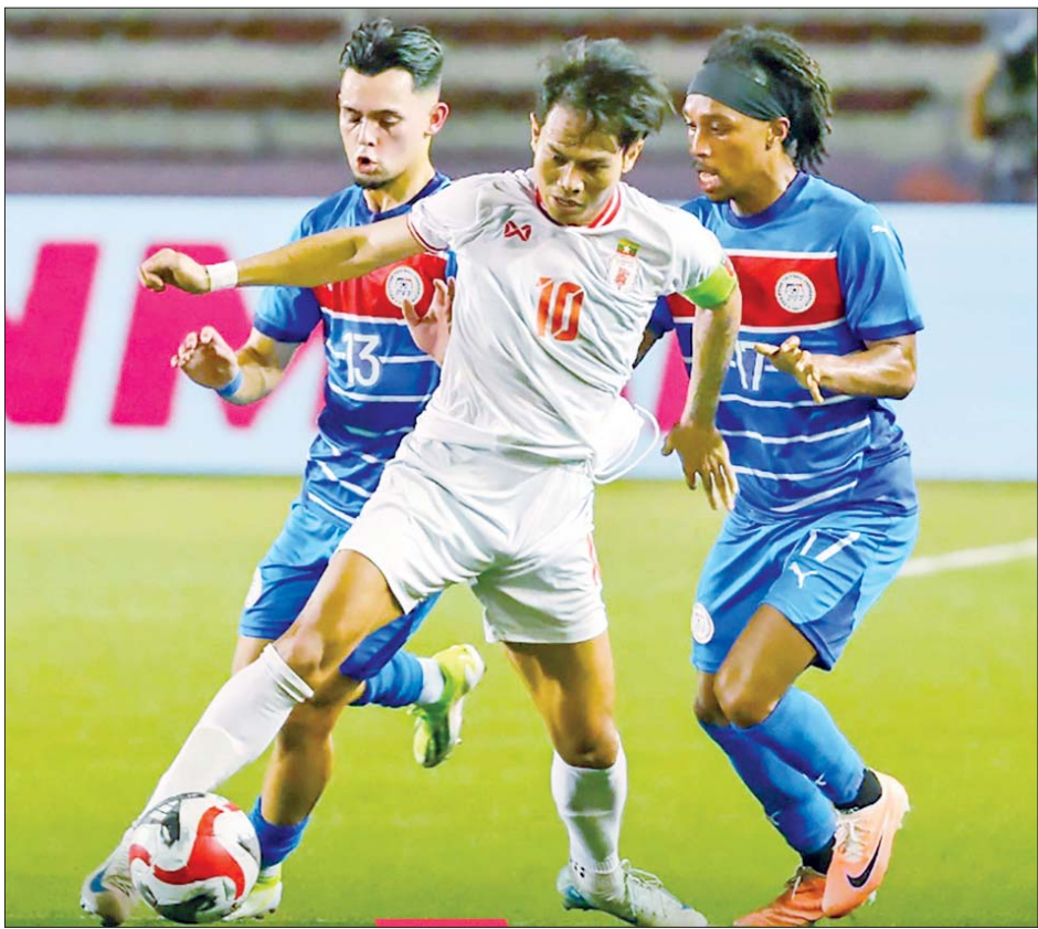
မြန်မာ့လက်ရွေးစင်အသင်းနှင့် ဖိလစ်ပိုင်အသင်းတို့ ယှဉ်ပြိုင်နေစဉ်။