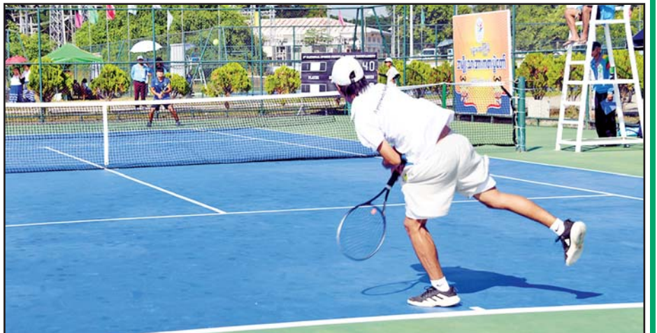
ပြည်နယ်နှင့် တိုင်းဒေသကြီး အမျိုးသား တင်းနစ်ပြိုင်ပွဲတွင် ပဲခူးတိုင်းဒေသကြီးနှင့် ဧရာဝတီ တိုင်းဒေသကြီးတို့မှ ပြိုင်ပွဲဝင်နှစ်ဦး ယှဉ်ပြိုင်ကစားကြစဉ်။