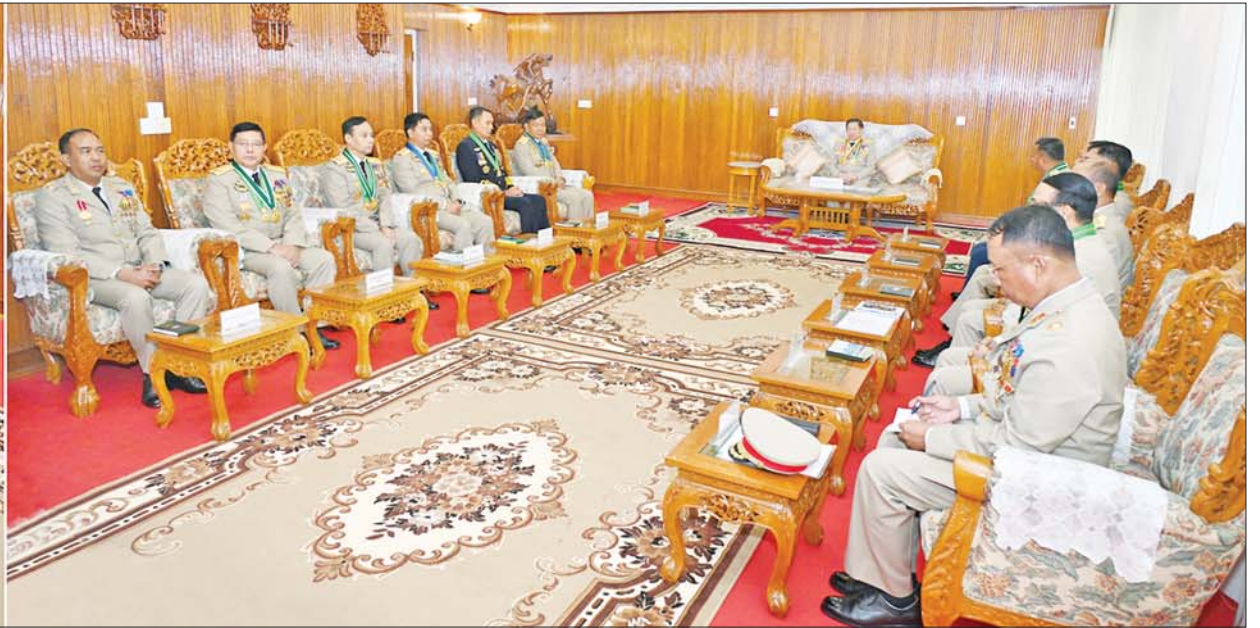
နိုင်ငံတော်စီမံအုပ်ချုပ်ရေးကောင်စီဥက္ကဋ္ဌ တပ်မတော်ကာကွယ်ရေးဦးစီးချုပ် ဗိုလ်ချုပ်မှူးကြီး သတိုးမဟာသရေစည်သူ သတိုးသီရိသုဓမ္မ မင်းအောင်လှိုင် ထူးချွန်ဆုရရှိကြသည့် ဗိုလ်လောင်းများနှင့် ၎င်းတို့၏ မိဘဆွေမျိုးများကို တွေ့ဆုံ၍ ဂုဏ်ပြုအမှာစကားပြောကြားစဉ်။