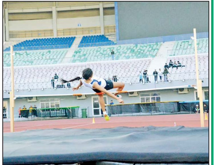
ပြည်နယ်နှင့် တိုင်းဒေသကြီး အမျိုးသမီး တန်းမြင့်ခုန်ပြိုင်ပွဲတွင် ပြိုင်ပွဲဝင် တစ်ဦး ယှဉ်ပြိုင်နေစဉ်။