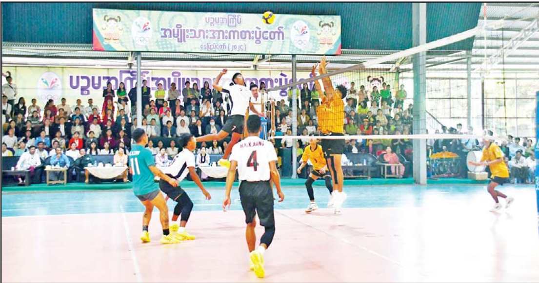
ဝန်ကြီးဌာနပေါင်းစုံ အမျိုးသားဘော်လီဘောပြိုင်ပွဲတွင် သာသနာရေးနှင့် ယဉ်ကျေးမှုဝန်ကြီးဌာနအသင်းနှင့် ပညာရေး ဝန်ကြီးဌာနအသင်းတို့ ယှဉ်ပြိုင်ကစားကြစဉ်။