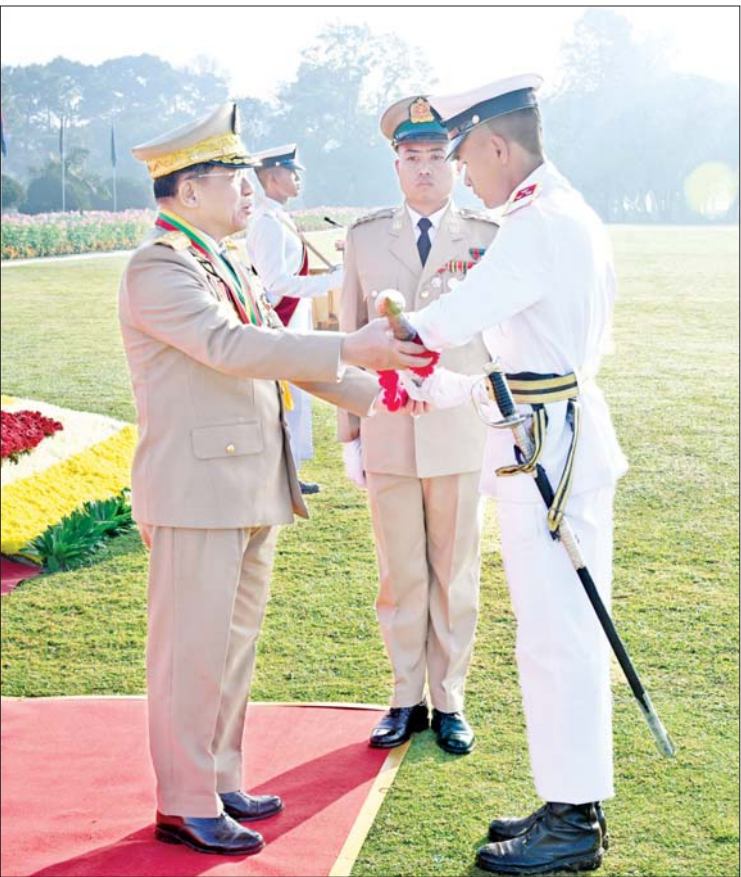
နိုင်ငံတော်စီမံအုပ်ချုပ်ရေးကောင်စီဥက္ကဋ္ဌ တပ်မတော်ကာကွယ်ရေးဦးစီးချုပ် ဗိုလ်ချုပ်မှူးကြီး သတိုးမဟာသရေစည်သူ သတိုးသီရိသုဓမ္မ မင်းအောင်လှိုင် တပ်မတော်နည်းပညာတက္ကသိုလ် ဗိုလ်လောင်းသင်တန်းအမှတ်စဉ်(၂၆)မှ အောင်စစ်သည်ဆုရရှိသူ ဗိုလ်လောင်းအမှတ် ၈၃၉၀ ဗိုလ်လောင်း ဖြိုးကိုကိုအား ဆုပေးအပ်ချီးမြှင့်စဉ်။

တပ်မတော် ကာကွယ်ရေးဦးစီးချုပ် ဗိုလ်ချုပ်မှူးကြီး သတိုးမဟာသရေစည်သူ သတိုးသီရိသုဓမ္မ မင်းအောင်လှိုင်အား အနှေးလျှောက်၊ အမြန်လျှောက်ဖြင့် ချီတက်အလေးပြုကြသည်။ ယင်းနောက် နိုင်ငံတော်စီမံအုပ်ချုပ် ရေးကောင်စီဥက္ကဋ္ဌ တပ်မတော်ကာကွယ် ရေးဦးစီးချုပ်ဗိုလ်ချုပ်မှူးကြီးသတိုးမဟာ သရေစည်သူ သတိုးသီရိသုဓမ္မ မင်းအောင်လှိုင်က တပ်မတော်နည်းပညာ တက္ကသိုလ်ဗိုလ်လောင်းသင်တန်း အမှတ် စဉ်(၂၆)မှ အောင်စစ်သည် ဆုရရှိသူ ဗိုလ်လောင်းအမှတ် ၈၃၉၀ ဗိုလ်လောင်း ဖြိုးကိုကို၊ လေ့ကျင့်ရေးထူးချွန်ဆုရရှိသူ ဗိုလ်လောင်းအမှတ် ၈၄၃၄ ဗိုလ်လောင်း သန်းထိုက်အောင်နှင့် စာပေထူးချွန်ဆု ရရှိသူ ဗိုလ်လောင်းအမှတ် ၈၄၅၃ ဗိုလ်လောင်း အောင်ဖြိုးခိုင် တို့အား ဆုများပေးအပ်ချီးမြှင့်သည်။ ဆက်လက်၍ နိုင်ငံတော်စီမံအုပ်ချုပ် ရေးကောင်စီဥက္ကဋ္ဌ တပ်မတော်ကာကွယ် ရေးဦးစီးချုပ်ဗိုလ်ချုပ်မှူးကြီးသတိုးမဟာ သရေစည်သူ သတိုးသီရိသုဓမ္မ မင်းအောင်လှိုင်က သင်တန်းဆင်းမိန့်ခွန်း ပြောကြားရာတွင် အင်ဂျင်နီယာတပ်ဖွဲ့ သည် တပ်မတော်၏ အားထားရသည့် လက်ရုံးဝန်ထမ်း တပ်ဖွဲ့တစ်ခုအဖြစ် ခေတ်အဆက်ဆက် တပ်မတော်(ကြည်း၊ ရေ၊ လေ)တပ်ရင်း/တပ်ဖွဲ့များအတွက် အင်ဂျင်နီယာပိုင်းဆိုင်ရာ ကဏ္ဍများမှာ စွမ်းစွမ်းတစ် လုပ်ဆောင်ပေးခဲ့သကဲ့သို့ နိုင်ငံတော် တည်ဆောက်ရေးလုပ်ငန်းများ