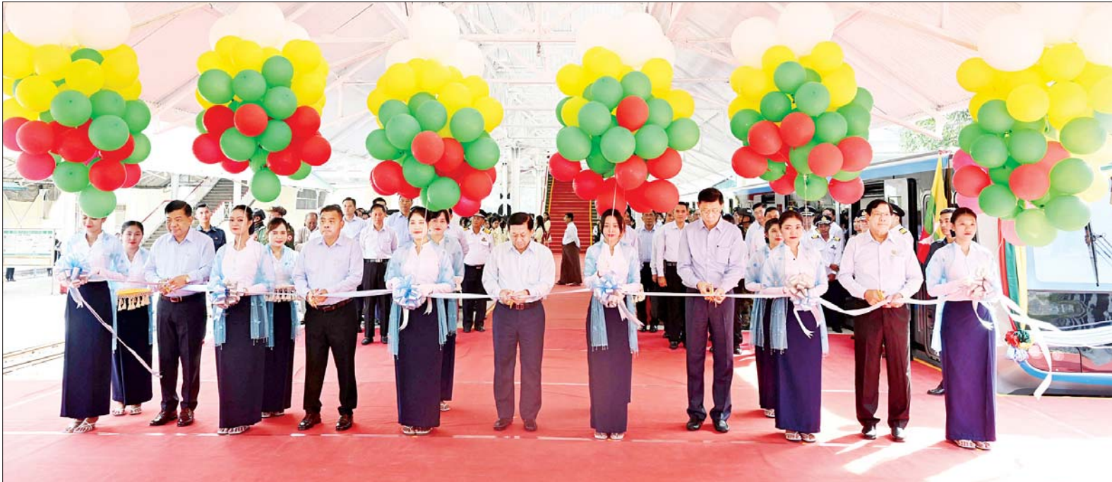
နိုင်ငံတော်စီမံအုပ်ချုပ်ရေးကောင်စီဥက္ကဋ္ဌ နိုင်ငံတော်ဝန်ကြီးချုပ် ဗိုလ်ချုပ်မှူးကြီးမင်းအောင်လှိုင်၊ ကောင်စီတွဲဖက်အတွင်းရေးမှူး ဗိုလ်ချုပ်ကြီးရဲဝင်းဦး၊ ကောင်စီဝင် ပြည်ထောင်စုဝန်ကြီး ဗိုလ်ချုပ်ကြီးမြထွန်းဦး၊ ကောင်စီဝင် ဗိုလ်ချုပ်ကြီးမောင်မောင်အေးနှင့် ရန်ကုန်တိုင်းဒေသကြီးဝန်ကြီးချုပ် ဦးစိုးသိန်းတို့ ရန်ကုန်မြို့ပတ်ခရီးစဉ်ပြေးဆွဲမည့် ခေတ်မီ DEMU ရထားတွဲဆိုင်းအသစ်များအား ဖဲကြိုးဖြတ်ဖွင့်လှစ်ပေးစဉ်။