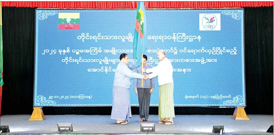
ဝန်ကြီးဌာနမှ ဌာနကိုယ်စားပြု ပါဝင်ယှဉ်ပြိုင်ကြမည့် အားကစားသမားများအနေဖြင့် အားကစားနည်းအလိုက် ရွှေတံဆိပ်နှင့် အခြားဆုအသီးသီးရယူ၍ ဝန်ကြီးဌာန၏ဂုဏ်ကို မြှင့်တင်နိုင်ရေး အစွမ်းကုန်ကြိုးပမ်းဆောင်ရွက်ကြရန် တိုက်တွန်းပြောကြားသည်။ ဆက်လက်၍ ဒုတိယဝန်ကြီးက အမှာစကားပြောကြားပြီး ပြည်ထောင်စုဝန်ကြီးက အောင်နိုင်ရေး

နေပြည်တော်တွင် ဒီဇင်ဘာ ၉ ရက်မှ ၂၀ ရက်အထိ တိုင်းဒေသကြီး/ ပြည်နယ်အားကစား နည်း ၂၃ နည်း၊ ဝန်ကြီးဌာနအဆင့် အားကစားနည်းခြောက်နည်းနှင့် မသန်စွမ်းအားကစားနည်း လေးနည်းတို့ဖြင့် ကျင်းပသွားမည်ဖြစ်ကြောင်း၊ မိမိတို့ဝန်ကြီးဌာနအနေဖြင့် ဘောလုံး (အမျိုးသား)၊ ဖူဆယ် (အမျိုးသား)၊ ဘော်လီဘော(အမျိုးသမီး)၊ ပိုက်ကျော်ခြင်း (အမျိုးသား)၊ ဂေါက်သီး(အမျိုးသား)၊ ပြေးခုန်ပစ် (အမျိုးသား/ အမျိုးသမီး) အားကစားနည်းတို့ဖြင့် ပါဝင်ယှဉ်ပြိုင်သွားကြမည်ဖြစ်ကြောင်း၊ ယခုအားကစားအောင်နိုင်ရေး အလံအပ်နှံခြင်းသည် နည်းပြများနှင့် အားကစားသမားများကို ရပ်ပိုင်းနှင့် စိတ်ပိုင်းဆိုင်ရာ၊ အားကစားပညာရပ်ဆိုင်ရာစသည်ဖြင့် အစစအရာရာ အသင့်ဖြစ်နေသည်ဟု ယုံကြည်သည့်အတွက် အားကစားမောင်မယ်များ၏ စိတ်စွမ်းအားကို မြှင့်တင်ပေးခြင်းဖြစ်ကြောင်း၊ မိမိတို့