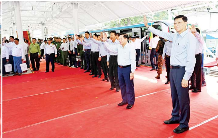
ရန်ကုန်မြို့ပတ် လက်ဝဲရစ်ခရီးစဉ်အဖြစ် ခေတ်မီ DEMU ရထားတွဲဆိုင်း စတင်ထွက်ခွာရာ နိုင်ငံတော်စီမံအုပ်ချုပ်ရေးကောင်စီဥက္ကဋ္ဌ နိုင်ငံတော်ဝန်ကြီးချုပ်နှင့် အဖွဲ့ဝင်များက ခရီးသွားပြည်သူများအား ရင်းရင်းနှီးနှီး နှုတ်ဆက်ကြစဉ်။