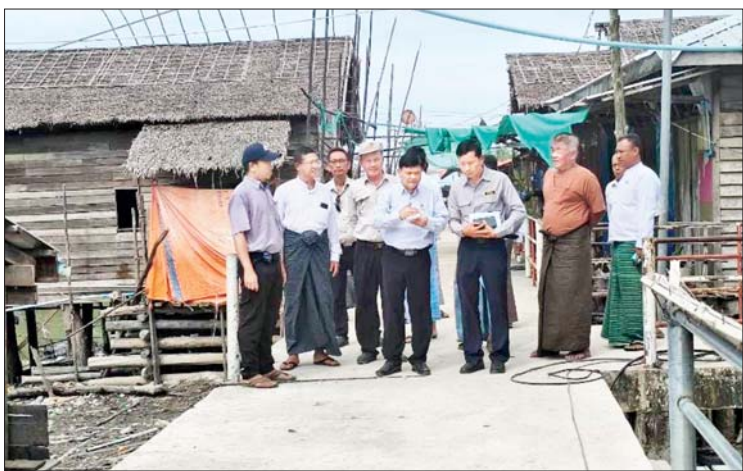
ပြည်သူလူထု၏ လမ်းပန်းဆက်သွယ်ရေး၊ ကဏ္ဍများ အကျိုးပြုနိုင်မည်ဖြစ်ကြောင်း မြို့နယ်(ပြန်/ဆက်)

အဆိုပါလုပ်ငန်းများ ရာနှုန်းပြည့်ပြီးစီးပါက ကလန်းချောင်းကျေးရွာရှိ