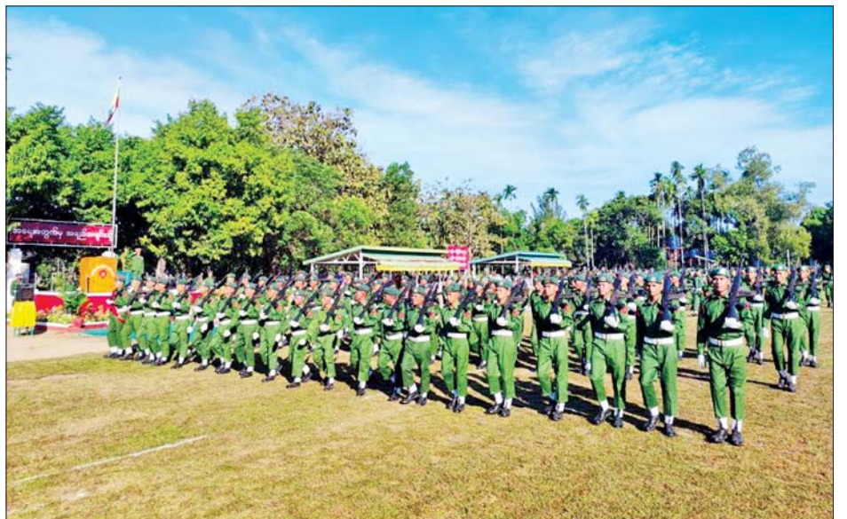
မွန်ပြည်နယ်၌ ပြည်သူ့စစ်မှုထမ်းသင်တန်း အမှတ်စဉ်(၅)သင်တန်းဆင်းပွဲ ကျင်းပစဉ်။