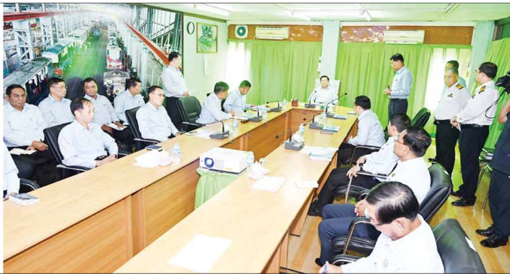
နိုင်ငံတော်စီမံအုပ်ချုပ်ရေးကောင်စီဥက္ကဋ္ဌ နိုင်ငံတော်ဝန်ကြီးချုပ် ဗိုလ်ချုပ်မှူးကြီးမင်းအောင်လှိုင်အား လျှပ်စစ်ရထားများ ပြေးဆွဲနိုင်ရေးဆောင်ရွက်မည့်လုပ်ငန်းများနှင့်ပတ်သက်၍ ပြည်ထောင်စုဝန်ကြီး ဗိုလ်ချုပ်ကြီး မြထွန်းဦးက ရင်းလင်းတင်ပြစဉ်။