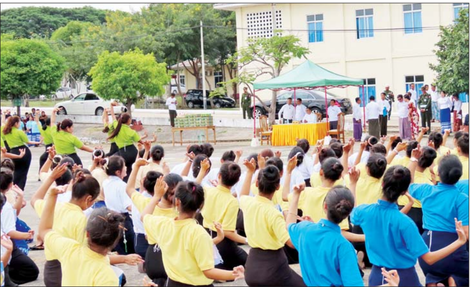
ကိုယ်စားပြု ဘောလုံးအသင်း၊ ဖူဆယ် (အမျိုးသား) အသင်း၊ ဘော်လီဘော (အမျိုးသား/ အမျိုးသမီး) အသင်း၊ ပိုက်ကျော်ခြင်းအသင်း၊ ပြေးခုန် ပစ်အသင်းတို့တွင် စုစုပေါင်းအုပ်ချုပ်သူနည်းပြ အပါအဝင် အားကစားသမား ၁၁၅ ဦး သည် ပဉ္စမအကြိမ် အမျိုးသားအားကစားပွဲတော်တွင် အားကစားနည်းခြောက်မျိုး ပါဝင်ယှဉ်ပြိုင်သွားမည်ဖြစ်ကြောင်း သိရသည်။

ကို ယခုကဲ့သို့ ကြိုးကြိုးစားစား လေ့ကျင့်နေကြသည်ကို တွေ့ရသည့်အတွက် ဝမ်းသာပါကြောင်း၊ နိုင်ငံတော်အဆင့်အခမ်းအနားကြီး၌ ပါဝင်ဖော်ဖြေတင်ဆက်ခွင့်ရခြင်းဖြစ်၍ ဂုဏ်ယူစရာဖြစ်ကြောင်း၊ အတွေ့အကြုံများလည်းရပါကြောင်း၊ တစ်ဦးနှင့်တစ်ဦးချစ်ခင်ရင်းနှီးမှုများလည်းရပါကြောင်း၊ ပျော်ပျော်ရွှင်ရွှင်ဖြင့် ကပြဖော်ဖြေတင်ဆက်သွားရန် တိုက်တွန်းပါကြောင်း အားပေးစကားပြောကြားပြီး အားဖြည့်အချီရည်နှင့် စားသောက်ဖွယ်ရာများ ထောက်ပံ့ပေးသည်။ ဆက်လက်၍ ဖူဆယ်(အမျိုးသား)အားကစားနှင့် ဘော်လီဘော(အမျိုးသား) အားကစားလေ့ကျင့်နေသည့် ဝန်ကြီးဌာနကိုယ်စားပြု အားကစားသမားများကို တွေ့ဆုံအားပေးစကားပြောကြားကာ အားဖြည့်အချီရည်နှင့် စားသောက်ဖွယ်ရာများ ထောက်ပံ့ပေးပြီး စွမ်းအင်ဝန်ကြီးဌာန ဘော်လီဘောအသင်းနှင့် ယှဉ်ပြိုင်လေ့ကျင့်နေမှုများကို ကြည့်ရှုအားပေးသည်။ သာသနာရေးနှင့် ယဉ်ကျေးမှုဝန်ကြီးဌာန