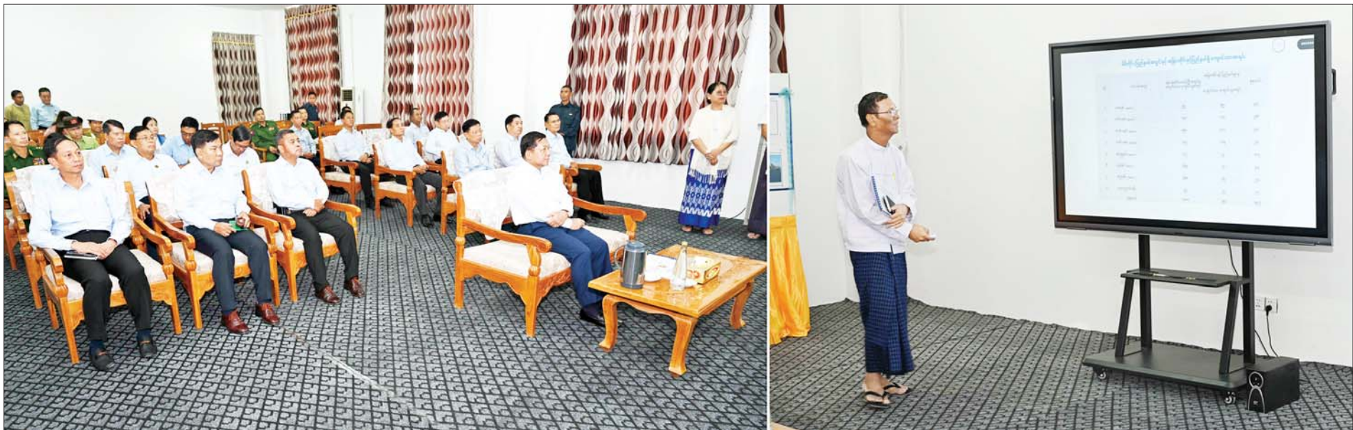
နိုင်ငံတော်စီမံအုပ်ချုပ်ရေးကောင်စီဥက္ကဋ္ဌ နိုင်ငံတော်ဝန်ကြီးချုပ် ဗိုလ်ချုပ်မှူးကြီးမင်းအောင်လှိုင်အား ရန်ကုန်အနောက်ပိုင်းနည်းပညာတက္ကသိုလ် ပါမောက္ခချုပ်က ပင်မသုံးထပ်စာသင်ဆောင်အသစ် တည်ဆောက်ပြီးစီးမှု အခြေအနေများနှင့်စပ်လျဉ်း၍ ရှင်းလင်းတင်ပြစဉ်။

✧ စာမျက်နှာ ၇ မှ ကောင်းမွန်မှုရှိရန် မိမိတို့အစိုးရ အဖွဲ့မှ တာဝန်ရှိသူများက လိုအပ် သည်များ ဖြည့်ဆည်းဆောင်ရွက် ပေးရမည်ဖြစ်ကြောင်းလှိုင်သာယာ တွင် ရေစီးရေလွှာကောင်းမွန်ရေး သည် အဓိကဖြေရှင်းဆောင်ရွက် ပေးရမည့် ကိစ္စတစ်ခုဖြစ်သဖြင့် အလေးထား ဆောင်ရွက်သွားရန် လိုကြောင်း၊ တစ်မြို့နယ်လုံး အတိုင်းအတာဖြင့် ရေဝင်ရေထွက် ကောင်းမွန်ရမည်ဖြစ်ကြောင်း၊ မြို့ပြ များ၌ စီမံလမ်းစဉ်ပြည်ရေး Green Zone ကို ဖော်ဆောင်ရာတွင် သုံးမိုင်ပတ်လည် အကွာအဝေး အတွင်း၌ Green Zone များ