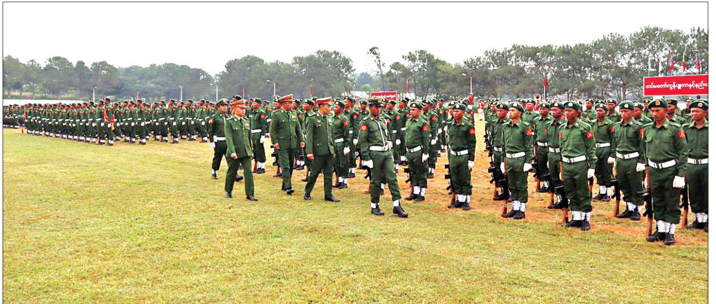
ရမ်းပြည်နယ်၌ ပြည်သူ့စစ်မှုထမ်းသင်တန်း အမှတ်စဉ်(၅)သင်တန်းဆင်းပွဲ ကျင်းပစဉ်။

အဆိုပါ ပြည်သူ့စစ်မှုထမ်းသင်တန်းအမှတ်စဉ်(၅)ကို စက်တင်ဘာ ၉ ရက်တွင် စတင်ဖွင့်လှစ်ခဲ့ခြင်းဖြစ်ပြီး သင်တန်းကာလအတွင်း ကြံ့ခိုင်ရေးဘာသာရပ်၊ စစ်ရေးပြဘာသာရပ်၊ ခြေလျင်လက်နက်ငယ်ဘာသာရပ်၊ စစ်နည်းဗျူဟာဘာသာရပ်များကို စာတွေ့၊ လက်တွေ့ စနစ်တကျသင်ကြား