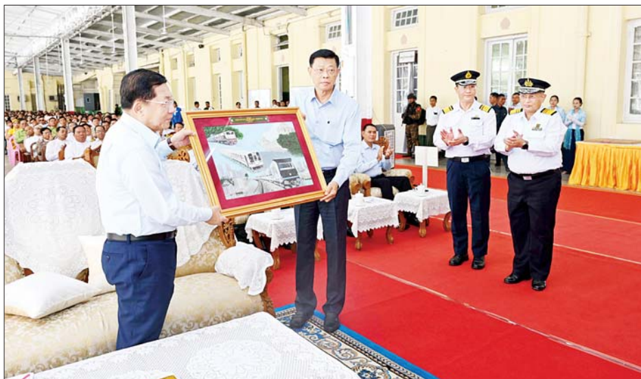
နိုင်ငံတော်စီမံအုပ်ချုပ်ရေးကောင်စီဥက္ကဋ္ဌ နိုင်ငံတော်ဝန်ကြီးချုပ် ဗိုလ်ချုပ်မှူးကြီး မင်းအောင်လှိုင်ထံ ကောင်စီဝင် ပြည်ထောင်စုဝန်ကြီး ဗိုလ်ချုပ်ကြီး မြထွန်းဦးက ရန်ကုန်မြို့ပတ်ရထားလမ်းပိုင်းတွင် ခေတ်မီ Diesel Electric Multiple Unit (DEMU) ရထားတွဲဆိုင်းအသစ်များဖြင့် စတင်ပြေးဆွဲခြင်း ဖွင့်ပွဲအခမ်းအနား အထိမ်းအမှတ်လက်ဆောင်အား ဂါရဝပြုပေးအပ်စဉ်။