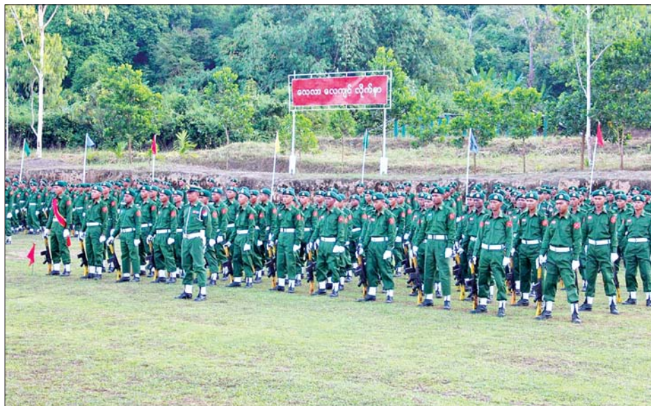
တနင်္သာရီတိုင်းဒေသကြီး၌ ပြည်သူ့စစ်မှုထမ်းသင်တန်း အမှတ်စဉ်(၅)သင်တန်းဆင်းပွဲ ကျင်းပစဉ်။

တပ်မတော်သားတိုင်းဟာ သူ့တာဝန်သူရှိတယ်။ အမိန့်ဆိုတဲ့စကားလုံးနောက်က သွားတာပေါ့။ တာဝန်ယူပြီး အလုပ်လုပ်ကိုင်ရတယ်။ တပ်မတော်သားတွေကို ကိုယ်ချင်းစာတတ်လာပါတယ်။ သင်တန်းဆင်းရတော့မယ်ဆိုတော့ ကျရာမိခင်တပ်ရင်းတွေမှာ ပေးအပ်တဲ့တာဝန်တွေကို ကျေပွန်စွာ အတတ်နိုင်ဆုံးထမ်းဆောင်ပြီးတော့ အမိမြန်မာနိုင်ငံတော်ကြီးကို စာမျက်နှာ ၁၇ သို့ ❖