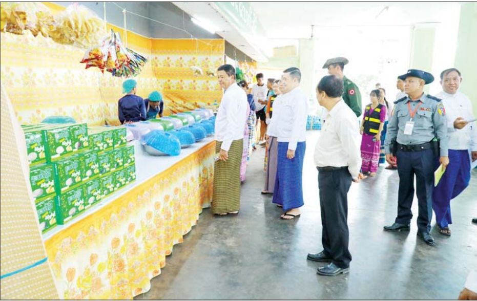
လိုကြောင်း၊ စံချိန်စံညွှန်းများ ကောင်းမွန်သည့် အားကစားသမားများကို ရွေးချယ်ပြီး နိုင်ငံ့ဂုဏ်ဆောင်နိုင်သည့် အားကစားသမားများဖြစ်အောင်

နေပြည်တော် နိုဝင်ဘာ ၂၉ ၂၀၂၄ ခုနှစ် ပဉ္စမအကြိမ် အမျိုးသားအားကစားပွဲတော် ပြိုင်ပွဲကျင်းပရေးဦးစီးကော်မတီ ဥက္ကဋ္ဌ အားကစားနှင့်လူငယ်ရေးရာဝန်ကြီးဌာန ပြည်ထောင်စုဝန်ကြီး ဦးမင်းသိန်းဇံသည် ယနေ့နံနက်ပိုင်းတွင် နေပြည်တော် တည်းခိုရေးစခန်း (ရွာတော်)သို့ သွားရောက်၍ ပဉ္စမအကြိမ် အမျိုးသားအားကစားပွဲတော်တွင် ပါဝင်ယှဉ်ပြိုင်ကြမည့် ပြည်နယ်နှင့်တိုင်းဒေသကြီးများမှ အားကစားသမားများ တည်းခိုနေထိုင်လျက်ရှိသည့် တည်းခိုဆောင်များ၊ ဆပ်ကော်မတီအလိုက် ရုံးခန်းဖွင့်လှစ်ထားရှိမှုများ၊ နေ့လယ်စာစားသောက်နေမှုများနှင့် ချက်ပြုတ်ပြင်ဆင်ဆောင်ရွက်နေမှုများကို ကြည့်ရှုစစ်ဆေးသည်။ မှာကြား ဦးစွာ ပြည်ထောင်စုဝန်ကြီးသည် ပဉ္စမအကြိမ် အမျိုးသားအားကစားပွဲတော်တွင် ပါဝင်ယှဉ်ပြိုင်ရန် ရောက်ရှိလာသည့် ပြည်နယ်နှင့်တိုင်းဒေသကြီးများမှ ပြိုင်ပွဲဝင်အသင်းများကို တွေ့ဆုံ၍ အားကစားသမားများအနေဖြင့် ကျန်းမာရေးအထူးဂရုစိုက်ကြရန်