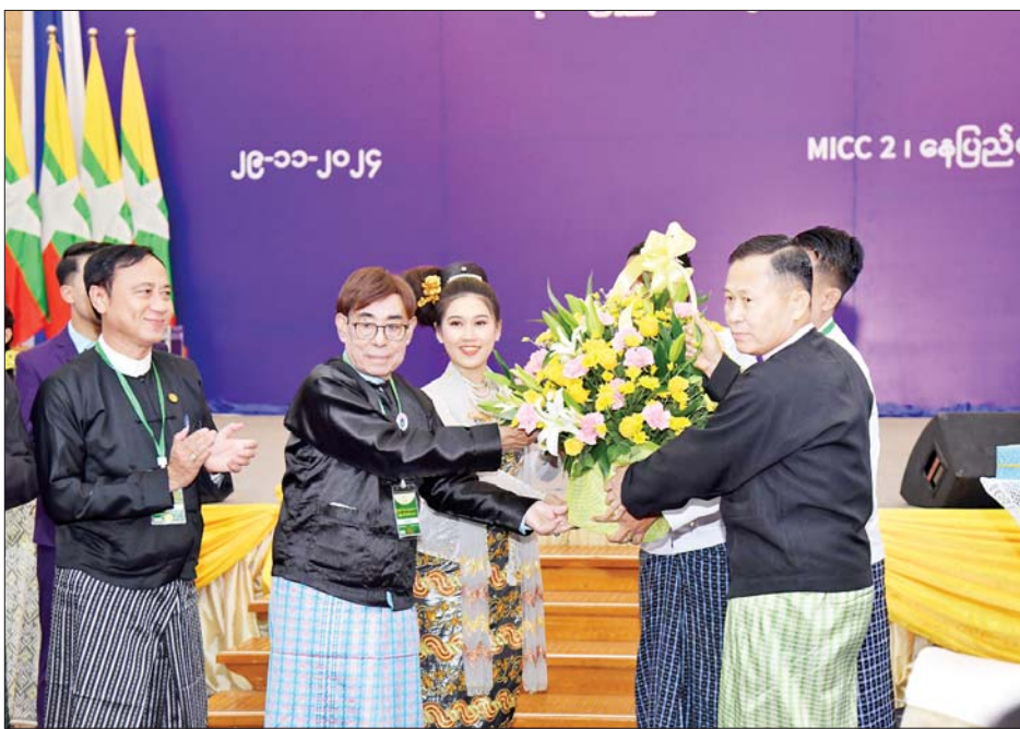
နိုင်ငံတော်စီမံအုပ်ချုပ်ရေးကောင်စီဒုတိယဥက္ကဋ္ဌ ဒုတိယဝန်ကြီးချုပ် ဒုတိယဗိုလ်ချုပ်မှူးကြီးစိုးဝင်း အနုပညာရှင်တစ်ဦးအား ဂုဏ်ပြုပန်းခြင်းနှင့် ဂုဏ်ပြုဆုငွေများပေးအပ်စဉ်။

စကားပြောကြားသည်။ ထို့နောက် နိုင်ငံတော်စီမံ အုပ်ချုပ်ရေးကောင်စီ ဒုတိယ ဥက္ကဋ္ဌ ဒုတိယဝန်ကြီးချုပ် ဒုတိယ ဗိုလ်ချုပ်မှူးကြီးစိုးဝင်းထံ ရင်းနှီး မြှုပ်နှံမှုနှင့် နိုင်ငံခြားစီးပွား ဆက်သွယ်ရေး ဝန်ကြီးဌာန ပြည်ထောင်စုဝန်ကြီး ဒေါက်တာ ကံဇော်က မြန်မာနိုင်ငံ “စီးပွားရေး ပညာနှစ် (၁၀၀)” ရာပြည့်အထိမ်း အမှတ်လက်ဆောင်ကို လက်ဝယ် အရောက် ပေးအပ်သည်။ ဂုဏ်ပြုလက်ဆောင် ပေးအပ် ယင်းနောက် ရင်းနှီးမြှုပ်နှံမှုနှင့် နိုင်ငံခြား စီးပွားဆက်သွယ်ရေး ဝန်ကြီးဌာန ပြည်ထောင်စုဝန်ကြီး ဒေါက်တာကံဇော်က ရန်ကုန်၊ မုံရွာနှင့် မိတ္ထီလာစီးပွားရေး တက္ကသိုလ်တို့မှ ပါမောက္ခချုပ် များနှင့် အမျိုးသားစီမံခန့်ခွဲမှု ဒီဂရီ ကောလိပ် ကျောင်းအုပ်ကြီးတို့ကို မြန်မာနိုင်ငံ “စီးပွားရေးပညာ နှစ် (၁၀၀)” ရာပြည့်အထိမ်းအမှတ် ဂုဏ်ပြုလက်ဆောင်များ ပေးအပ်