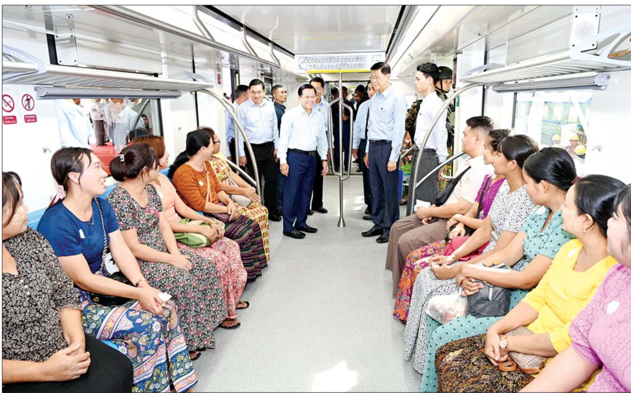
နိုင်ငံတော်စီမံအုပ်ချုပ်ရေးကောင်စီဥက္ကဋ္ဌ နိုင်ငံတော်ဝန်ကြီးချုပ် ဗိုလ်ချုပ်မှူးကြီး မင်းအောင်လှိုင်နှင့်အဖွဲ့ဝင်များ ရန်ကုန်မြို့ပတ်လက်ယာရစ်ခရီးစဉ်အဖြစ် ခေတ်မီ DEMU ရထားတိုဆိုင်းအသစ်များဖြင့် လိုက်ပါစီးနင်းပြီး ခရီးသွားပြည်သူများအား ရင်းရင်းနှီးနှီးနှုတ်ဆက်စဉ်။

အုပ်ချုပ်ရေးကောင်စီဥက္ကဋ္ဌ နိုင်ငံတော်ဝန်ကြီးချုပ်ထံ ကောင်စီဝင် ပို့ဆောင်ရေးနှင့် ဆက်သွယ်ရေး ဝန်ကြီးဌာန ပြည်ထောင်စုဝန်ကြီး က ရန်ကုန်မြို့ပတ်ရထားလမ်းပိုင်းတွင် ခေတ်မီ Diesel Electric Multiple Unit (DEMU) ရထား တွဲဆိုင်းအသစ်များဖြင့် စတင် ပြေးဆွဲခြင်း ဖွင့်ပွဲအခမ်းအနား