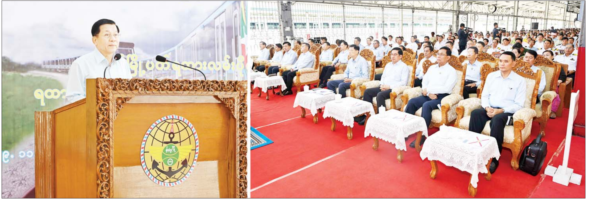
နိုင်ငံတော်စီမံအုပ်ချုပ်ရေးကောင်စီဥက္ကဋ္ဌ နိုင်ငံတော်ဝန်ကြီးချုပ် ဗိုလ်ချုပ်မှူးကြီးမင်းအောင်လှိုင် ရန်ကုန်မြို့ပတ်ရထားလမ်းပိုင်းတွင် ခေတ်မီ Diesel Electric Multiple Unit (DEMU) ရထားတွဲဆိုင်းအသစ်များဖြင့် စတင်ပြေးဆွဲခြင်း ဖွင့်ပွဲအခမ်းအနားတွင် အမှာစကားပြောကြားစဉ်။

»» စာမျက်နှာ ၄ မှ ထိုကဲ့သို့ ရန်ကုန် - ပြည်ရထား လမ်းပိုင်း စတင်ပြေးဆွဲနိုင်ခဲ့ခြင်း သည် အရှေ့တောင်အာရှနိုင်ငံများ အနက် မြန်မာနိုင်ငံက ပထမဦး ဆုံးဖြစ်ခဲ့ကြောင်း၊ အရှေ့တောင် အာရှ၏ သက်တမ်းအရင့်ဆုံး ရထားပို့ဆောင်ရေး လုပ်ငန်းကို ပိုင်ဆိုင်ထားသည့်နိုင်ငံဟု ဆိုနိုင် ကြောင်း၊ လက်ရှိကာလတွင် နိုင်ငံအတွင်း ရထားလမ်းခရီးမိုင် စုစုပေါင်း ၃၈၀၀ ကျော်နှင့် ဘူတာ ရုံပေါင်း ၉၆၂ ခုအထိ တည်ဆောက် နိုင်ခဲ့ကြောင်း။