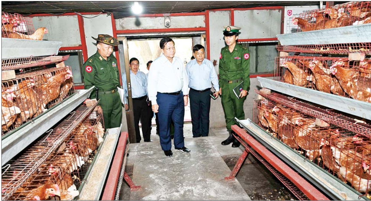
နိုင်ငံတော်စီမံအုပ်ချုပ်ရေးကောင်စီဥက္ကဋ္ဌ နိုင်ငံတော်ဝန်ကြီးချုပ် ဗိုလ်ချုပ်မှူးကြီးမင်းအောင်လှိုင် အင်းစိန်မြို့နယ်ရှိ ရန်ကုန်တိုင်းစစ်ဌာနချုပ် အမှတ်(၁) စိုက်ပျိုးမွေးမြူရေးစခန်းအတွင်း ကြည့်ရှုစစ်ဆေးစဉ်။

စာမျက်နှာ ၃ မှ အဆိုပါ တာယာစက်ရုံ(ရွာမ)မှ ထုတ်လုပ်သည့် TRI STAR တာယာများကို ပြည်ပနိုင်ငံများသို့ တင်ပို့ရလျက်ရှိပြီး အရည်အသွေးကောင်းမွန် ခိုင်ခံ့မှုများကြောင့် ပြည်ပဈေးကွက်တွင် လူကြိုက်များသည့် တာယာအမျိုးအစားအဖြစ် ရပ်တည်လျက်ရှိကြောင်း၊ သုတေသနပြု ဆန်းစစ်ချက်များအရ ပြည်ပမှ တင်သွင်းသည့် အခြားတာယာများထက် TRI STAR တာယာများသည် အရည်အသွေးကောင်းမွန်ခိုင်ခံ့မှုရှိသည့်အပြင် ဈေးနှုန်းမှန်ကန်စွာဖြင့်လည်း ပြည်တွင်း၌ ဝယ်ယူသုံးစွဲနိုင်ကြောင်း သိရသည်။ ရှင်းလင်းတင်ပြဆက်လက်၍ နိုင်ငံတော်စီမံအုပ်ချုပ်ရေးကောင်စီ ဥက္ကဋ္ဌ နိုင်ငံတော်ဝန်ကြီးချုပ်နှင့် အဖွဲ့ဝင်များသည် အင်းစိန်မြို့နယ်ရှိရန်ကုန်တိုင်းစစ်ဌာနချုပ် အမှတ်(၁) စိုက်ပျိုးမွေးမြူရေးစခန်းသို့ ရောက်ရှိကြရာ ရှင်းလင်းဆောင်ခန်းမ၌ တိုင်းမှူးက ရန်ကုန်တိုင်းစစ်ဌာနချုပ် စိုက်ပျိုးမွေးမြူရေးခြံများတွင် စိုက်ပျိုးမွေးမြူရေးလုပ်ငန်းများ ဆောင်ရွက်ထားရှိမှု၊ ထွက်ရှိလာသည့် အသား၊ ငါး၊ ဟင်းသီးဟင်းရွက်၊ ကြက်ဥ၊ ဘဲဥနှင့် နွားနို့များကို အရာရှိ စစ်သည်