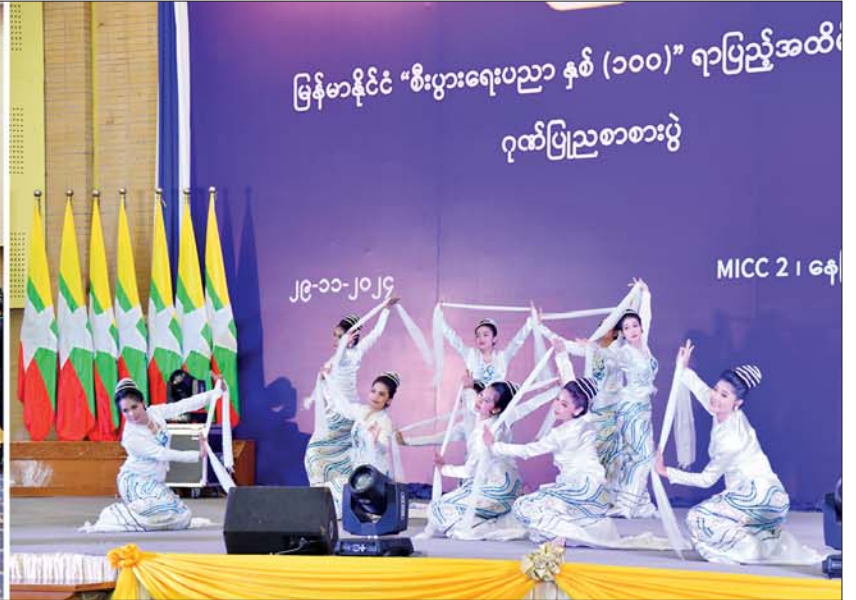
နိုင်ငံတော်စီမံအုပ်ချုပ်ရေးကောင်စီဒုတိယဥက္ကဋ္ဌ ဒုတိယဝန်ကြီးချုပ် ဒုတိယဗိုလ်ချုပ်မှူးကြီးစိုးဝင်းနှင့် တာဝန်ရှိသူများ မြန်မာနိုင်ငံ “စီးပွားရေးပညာ နှစ် (၁၀၀)” ရာပြည့်အထိမ်းအမှတ် ဂုဏ်ပြုညစာစားပွဲ အခမ်းအနားတွင် အနုပညာရှင်များ၏ ကပြဖျော်ဖြေမှုများကို ကြည့်ရှုအားပေးစဉ်။

★ကျောဖုံးမှ ပြည်ထောင်စုအဆင့် ပုဂ္ဂိုလ်များ၊ ပြည်ထောင်စုဝန်ကြီးများနှင့် ဇနီးများ၊ နေပြည်တော်ကောင်စီ ဥက္ကဋ္ဌ တပ်မတော်အရာရှိကြီးများ၊ ဒုတိယဝန်ကြီးများ၊ မြန်မာနိုင်ငံ စီးပွားရေးပညာ နှစ် (၁၀၀) ရာပြည့် အထိမ်းအမှတ် အခမ်းအနား ကျင်းပရေးဦးဆောင်ကော်မတီနှင့် ဆပ်ကော်မတီဝင်များ၊ စီးပွားရေး ပညာရပ်ဆိုင်ရာ အသင်းအဖွဲ့များ မှ ကိုယ်စားလှယ်များ၊ UMFCCL နှင့် ညီနောင်အသင်းများ၊ စီးပွားရေးဆိုင်ရာ တက္ကသိုလ်ဆရာကြီး ဆရာမကြီးများနှင့် ကျောင်းသား ကျောင်းသူများ၊ ကျောင်းသား ဟောင်းများ၊ စာတမ်းရှင်များ၊ တာဝန်ရှိသူများနှင့် ဖိတ်ကြား ထားသူများ တက်ရောက်ကြ သည်။ ဦးစွာ နိုင်ငံတော်စီမံအုပ်ချုပ်ရေး ကောင်စီဒုတိယဥက္ကဋ္ဌ ဒုတိယ ဝန်ကြီးချုပ် ဒုတိယဗိုလ်ချုပ် မှူးကြီးစိုးဝင်းက ဂုဏ်ပြုအမှာ