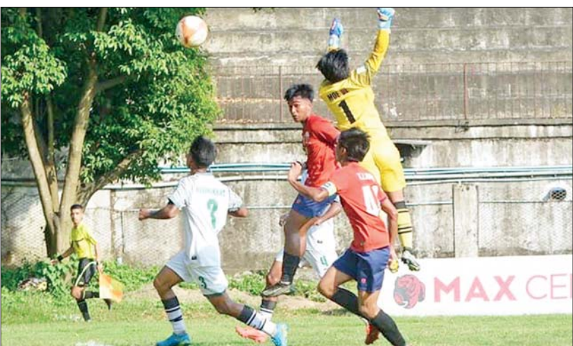
ရခိုင်ယူနိုက်တက်နှင့် မြဝတီအသင်းတို့ ယှဉ်ပြိုင်နေစဉ်။