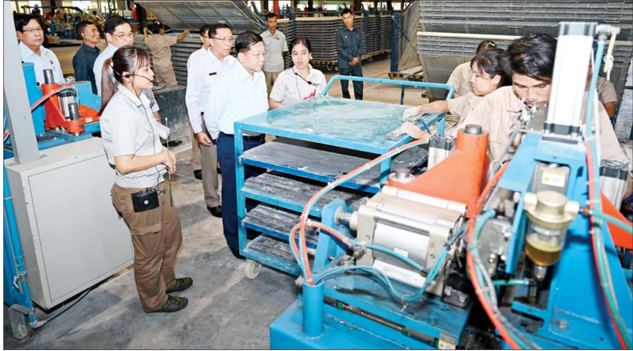
နိုင်ငံတော်စီမံအုပ်ချုပ်ရေးကောင်စီဥက္ကဋ္ဌ နိုင်ငံတော်ဝန်ကြီးချုပ် ဗိုလ်ချုပ်မှူးကြီးမင်းအောင်လှိုင် မြန်မာစီးပွားရေးကော်ပိုရေးရှင်း တာယာစက်ရုံ(ရွာမ)အတွင်း ကြည့်ရှုစစ်ဆေးစဉ်။