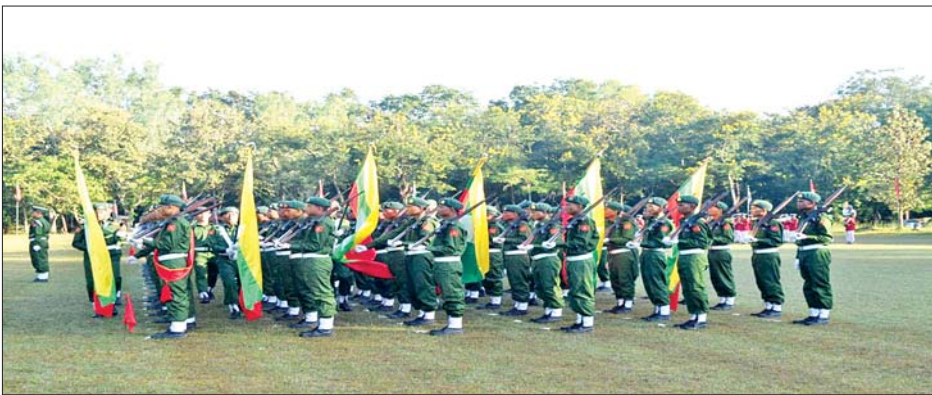
ပဲခူးတိုင်းဒေသကြီး၌ ပြည်သူ့စစ်မှုထမ်းသင်တန်းအမှတ်စဉ်(၅)သင်တန်းဆင်းပွဲ ကျင်းပစဉ်။

ဘုတ်ပြင်း နိုဝင်ဘာ ၂၉ ၂၀၂၄-၂၀၂၅ ဘဏ္ဍာနှစ် တနင်္သာရီတိုင်းဒေသကြီးဘုတ်ပြင်းခရိုင် ကျေးလက်ဒေသဖွံ့ဖြိုးတိုးတက်ရေး ဦးစီးဌာနက တိုင်းဒေသကြီးရန်ပုံငွေ ကျပ် ၁၀၃ သန်းဖြင့် ကလန်းချောင်းကျေးရွာတွင် လူလျှောက်လမ်းတံတား တည်ဆောက်ခြင်းလုပ်ငန်း ဆောင်ရွက်ပြီးစီးမှုအခြေအနေများကို တာဝန်ရှိသူများက နိုဝင်ဘာ ၂၇ ရက် နံနက်ပိုင်းက ကွင်းဆင်းစစ်ဆေးရာ တိုင်းဒေသကြီး လမ်းပန်းဆက်သွယ်ရေးဝန်ကြီး ဦးသက်နိုင်က လိုအပ်သည်များကို လမ်းညွှန်မှာကြားသည်။