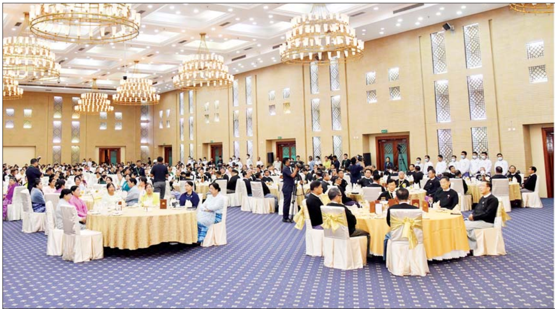
နိုင်ငံတော်စီမံအုပ်ချုပ်ရေးကောင်စီဒုတိယဥက္ကဋ္ဌ ဒုတိယဝန်ကြီးချုပ် ဒုတိယဗိုလ်ချုပ်မှူးကြီးစိုးဝင်း မြန်မာနိုင်ငံ “ စီးပွားရေးပညာ နှစ် (၁၀၀) ” ရာပြည့်အထိမ်းအမှတ် ဂုဏ်ပြုညစာစားပွဲအခမ်းအနားတွင် အမှာစကားပြောကြားစဉ်။

နေပြည်တော် နိုဝင်ဘာ ၂၉ မြန်မာနိုင်ငံ “စီးပွားရေးပညာ နှစ်(၁၀၀)” ရာပြည့်အထိမ်းအမှတ် ဂုဏ်ပြုညစာစားပွဲ အခမ်းအနား ကို ယနေ့ညပိုင်းတွင် နေပြည် တော်ရှိမြန်မာအပြည်ပြည်ဆိုင်ရာ ကွန်ဗင်းရှင်းဗဟိုဌာန-၂ (MICC-II) ၌ကျင်းပရာ နိုင်ငံတော်စီမံ အုပ်ချုပ်ရေးကောင်စီ ဒုတိယ ဥက္ကဋ္ဌ ဒုတိယဝန်ကြီးချုပ် ဒုတိယ ဗိုလ်ချုပ်မှူးကြီးစိုးဝင်း တက်ရောက် ချီးမြှင့်သည်။ အခမ်းအနားသို့ နိုင်ငံတော်စီမံ အုပ်ချုပ်ရေးကောင်စီ ဒုတိယ ဥက္ကဋ္ဌ ဒုတိယဝန်ကြီးချုပ်၏ဇနီး ဒေါ်သန်းသန်းနွယ်၊ ကောင်စီ အဖွဲ့ဝင်များနှင့် ဇနီးများ၊ စာမျက်နှာ ၉ ကော်လံ ၁ သို့★