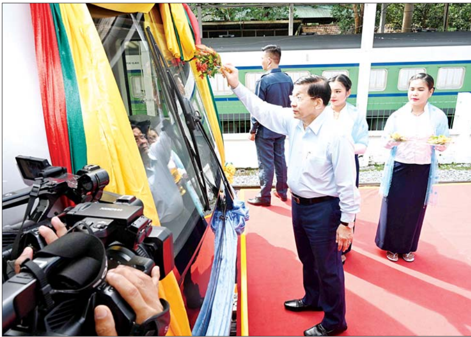
နိုင်ငံတော်စီမံအုပ်ချုပ်ရေးကောင်စီဥက္ကဋ္ဌ နိုင်ငံတော်ဝန်ကြီးချုပ် ဗိုလ်ချုပ်မှူးကြီးမင်းအောင်လှိုင် မီးရထားစက်ခေါင်းအား အမွှေးနံ့သာရည်များဖြင့် ပက်ဖျန်းပေးစဉ်။

ဖွံ့ဖြိုးတိုးတက်မှုအတွက် အခြေခံအကျဆုံးနှင့် အရေးကြီးဆုံး လိုအပ်ချက်ဖြစ် အခြေခံလူတန်းစား ပြည်သူ အများစု နေ့စဉ်နှင့်အမျှ အဓိက အားကိုးအားထား ပြုနေရသည့် ရထား သယ်ယူပို့ဆောင်ရေး လုပ်ငန်းသည် ဖွံ့ဖြိုးတိုးတက်မှု အတွက် အခြေခံအကျဆုံးနှင့် အရေးကြီးဆုံး လိုအပ်ချက်ဖြစ် သည်ဟု သုံးသပ်ဖော်ထုတ်နိုင် ကြောင်း၊ စရိတ်စက သက်သာစွာ ဖြင့် ခရီးသည်အများအပြားကို လိုရာခရီးသို့ ပို့ဆောင်ပေးနိုင်