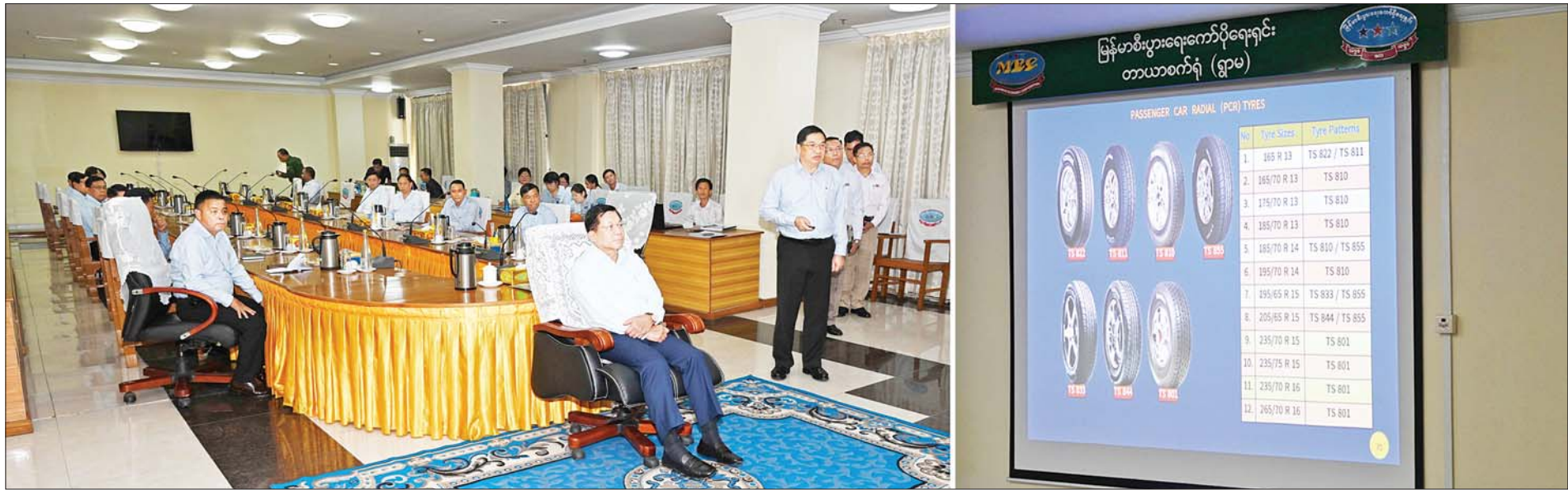
နိုင်ငံတော်စီမံအုပ်ချုပ်ရေးကောင်စီဥက္ကဋ္ဌ နိုင်ငံတော်ဝန်ကြီးချုပ် ဗိုလ်ချုပ်မှူးကြီးမင်းအောင်လှိုင်အား မြန်မာစီးပွားရေးကော်ပိုရေးရှင်းဥက္ကဋ္ဌ ဗိုလ်ချုပ်ကြီးညိုစောက စက်ရုံလုပ်ငန်းဆောင်ရွက်နေမှုနှင့် ပတ်သက်၍ ရှင်းလင်းတင်ပြစဉ်။

( ၃-၉-၂၀၂၄ ရက်နေ့တွင် နိုင်ငံတော်စီမံအုပ်ချုပ်ရေးကောင်စီဥက္ကဋ္ဌ နိုင်ငံတော် ဝန်ကြီးချုပ် ဗိုလ်ချုပ်မှူးကြီး မင်းအောင်လှိုင် ရှမ်းပြည်နယ် အစိုးရအဖွဲ့ဝင်များ၊ ပြည်နယ်နှင့် ခရိုင်အဆင့် ဌာနဆိုင်ရာတာဝန်ရှိသူများအား ပြောကြားသည့် အမှာ စကားမှ ကောက်နုတ်ချက် )