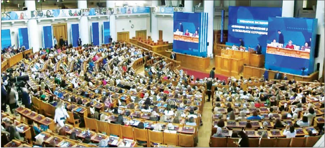
ရှေးဟောင်းအရေရှင်းနိုင်ငံ စိန့်ပီတာစဘတ်မြို့၌ ကျင်းပသည့် စတုတ္ထအကြိမ်မြောက် ယူရေးရှားအမျိုးသမီးဖိုရမ်ကို တွေ့ရစဉ်။