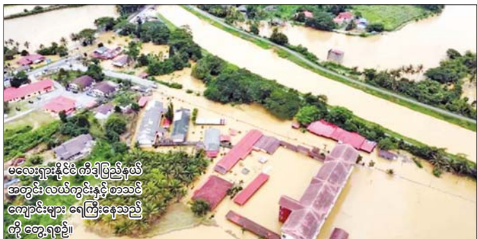
မလေးရှားနိုင်ငံ ကီဒါပြည်နယ် အတွင်း လယ်ကွင်းနှင့် စာသင်ကျောင်းများ ရေကြီးနေသည့်တို့ တွေ့ရစဉ်။