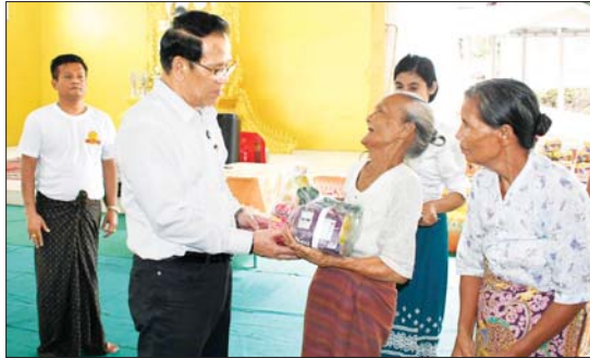
ပြည်ထောင်စုဝန်ကြီး ဦးမောင်မောင်အုန်း ယှဉ်းမနားမြို့မဟာလယ်တီစံကျောင်းတိုက်ရှိ ရေဘေးသင့်ပြည်သူများအား စားသောက်ကုန်များ ထောက်ပံ့ပေးအပ်စဉ်။

ထို့နောက် အဆိုပါကျောင်းတိုက်ရှိ မဟာဇနကဗိမာန်တော်၌ ရေဘေးသင့်ပြည်သူများကို ရင်းရင်းနှီးနှီး တွေ့ဆုံနှုတ်ဆက်၍ ပြည်ထောင်စုဝန်ကြီးများနှင့်အတူ အနုပညာရှင်များက လှူဒါန်းရခြင်းအကြောင်း ရင်းလင်းပြောကြားကာ အားပေးစကားပြောကြားကြသည်။ ယင်းနောက် ပြည်ထောင်စုဝန်ကြီးများ၊ M Entertainment Channel နှင့် Elavate Broadcast Myanmar Co.,Ltd တို့မှ တာဝန်ရှိသူများနှင့် အနုပညာရှင်များက ရေဘေးသင့်ပြည်သူများအတွက် လူသုံးကုန်များ၊ စားသောက်ကုန်များနှင့် ဆေးဝါးများကိုထောက်ပံ့ပေးအပ်ကြသည်။