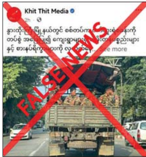
များအပေါ် ပြည်သူများ အထင်အမြင်လွှဲမှား စေရန် မဟုတ်မမှန် လုပ်ကြံရေးသားနေခြင်း သာဖြစ်ကြောင်း သတင်းရရှိသည်။

များက လိုအပ်သည့် နယ်မြေလုံခြုံရေး ဆောင်ရွက်ခဲ့ရာ အကြမ်းဖက်သမားများ ထိခိုက်သေဆုံးများစွာဖြင့် ဆုတ်ခွာထွက်ပြေး သွားခဲ့ကြောင်း၊ ထို့နောက် စက်တင်ဘာ ၁၈ ရက်တွင်လည်း ဝက်လူးကျေးရွာကို လက်နက် ကြီးများဖြင့် ထပ်မံပစ်ခတ်တိုက်ခိုက်ခဲ့သည့် အတွက် နေအိမ်များ ထိခိုက်ပျက်စီးခဲ့ရကြောင်း နှင့် လုံခြုံရေးတပ်ဖွဲ့ဝင်များက နေအိမ်များမှ ပစ္စည်းများကို လုယက်ယူဆောင်ခြင်း မရှိခဲ့ ကြောင်း လုံခြုံရေးတာဝန်ရှိသူတစ်ဦး၏ ပြောကြားချက်အရ သိရသည်။ တရားမဝင်ပြည်ဖျက်မီဒီယာများက PDF အမည်ခံအကြမ်းဖက်သမား၏ လက်နက်ကြီး ပစ်ခတ်မှုကြောင့် နေအိမ်များထိခိုက်ပျက်စီး သွားခဲ့သည်ကို ဖုံးကွယ်ပြီး လုံခြုံရေးတပ်ဖွဲ့ဝင်