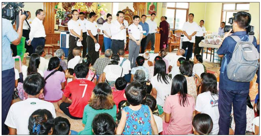
ပြည်ထောင်စုဝန်ကြီး ဦးမောင်မောင်အုန်းနှင့် ဦးမြင့်ကြိုင် တပ်ကုန်းမြို့ ချမ်းမြေ့မြိုင်ရိပ်သာကျောင်းတိုက် ရေဘေးကယ်ဆယ်ရေးစခန်းရှိ ရေဘေးသင့်ပြည်သူများအား အားပေးစကားပြောကြားစဉ်။

ဆက်လက်၍ မြန်မာ့အသံနှင့် ရုပ်မြင်သံကြားခေတ်ပေါ်တီးဝိုင်းအဖွဲ့နှင့်အတူ နာမည်ကျော်တေးသံရှင်များဖြစ်ကြသည့် ယုန်လေး၊ ဂျင်းနီ၊ ဟာသပညာရှင်များ ဖြစ်ကြသည့် အကယ်ဒမီအုန်းသီး၊ ဒိန်းဒေါင်နှင့် အနုပညာရှင်များ၊ MRTV မှ ဝန်ထမ်းတေးသံရှင်များက ရေဘေးသင့်ပြည်သူများ စိတ်ဓာတ်ခွန်အား တက်ကြွစေမည့်တေးသီချင်းများဖြင့် သီဆိုဖျော်ဖြေကြသည်။ ထို့နောက် ပြည်ထောင်စုဝန်ကြီး ဦးမောင်မောင်အုန်းက ရေဘေးသင့်ပြည်သူများကို ရင်းရင်းနှီးနှီး လိုက်လံ နှုတ်ဆက်ပြီး ရေဘေးသင့်ပြည်သူများ၏ အခက်အခဲများနှင့် ဆောင်ရွက်ပေးစေရန် သည်များကို မေးမြန်း၍ ဌာနဆိုင်ရာ တာဝန်ရှိသူများနှင့် ပေါင်းစပ်ညှိနှိုင်း ဆောင်ရွက်ပေးသည်။ အဆိုပါ မဟာဇနကကျောင်းတိုက် ရေဘေးကယ်ဆယ်ရေးစခန်းတွင် အနော်ရထာရပ်ကွက်၊ ဘုရင့်နောင်ရပ်ကွက်နှင့် မြောက်ရွှေစုကျေးရွာ၊ စုစုပေါင်းရပ်ကွက်/