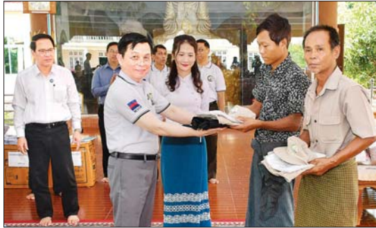
ပြည်ထောင်စုဝန်ကြီး ဦးမြင့်ကြိုင် တပ်ကုန်းမြို့ မဟာဇနကကျောင်းတိုက်ရှိ ရေဘေးသင့်ပြည်သူများအား လူသုံးကုန်များ ထောက်ပံ့စဉ်။

အဆိုပါသပြေတောင်တောရကျောင်းတိုက်တွင် ရပ်ကွက် / ကျေးရွာများမှ ရေဘေးသင့်ပြည်သူ စုစုပေါင်းဦးရေ ၃၅၀ နှင့် မဟာလယ်တီစံကျောင်းတိုက်တွင် ရပ်ကွက် / ကျေးရွာများမှ ရေဘေးသင့်ပြည်သူ ၃၉၉ ဦးတို့ကို ကူညီကယ်ဆယ် စောင့်ရှောက်ထားကြောင်း သိရသည်။ ယှဉ်းမနားမြို့နယ်မှ ရေဘေးသင့်ပြည်သူများအတွက် ပြန်ကြားရေးဝန်ကြီးဌာနက လူသုံးကုန်၊ စားသောက်ကုန်များနှင့် ဆေးဝါးများ စုစုပေါင်းတန်ဖိုးငွေကျပ် သိန်း ၅၀ အား လှူဒါန်းခဲ့ကြသည်။ သတင်းစဉ်