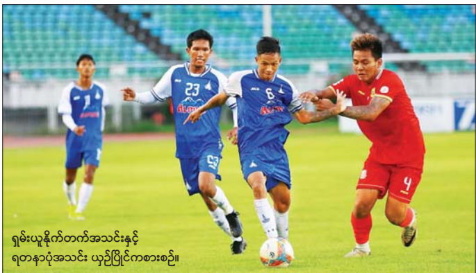
ရှမ်းယူနိုက်တက်အသင်းနှင့် ရတနာပုံအသင်း ယှဉ်ပြိုင်ကစားစဉ်။

ရန်ကုန် စက်တင်ဘာ ၂၀ ၂၀၂၄ - ၂၀၂၅ ရာသီ MNL အမှတ်ပေးပြိုင်ပွဲပွဲစဉ်(၁၁) ပထမနေ့ကို စက်တင်ဘာ ၂၀ ရက် ကကျင်းပရာ လက်ရှိချန်ပီယံ ရှမ်းယူနိုက်တက်အသင်း ဦးပြတ် နိုင်ပွဲရယူပြီး ရာသီဝက်ချန်ပီယံ အဖြစ် ရပ်တည်နိုင်ခဲ့သည်။ သုဝဏ္ဏကွင်း၌ ကျင်းပသည့် ပွဲတွင် ရှမ်းယူနိုက်တက်အသင်းက ရတနာပုံအသင်းကို ငါးဂိုး-တစ်ဂိုး ဖြင့် အနိုင်ရခဲ့သည်။ ရှမ်းယူနိုက်တက်အသင်းသည် နှိပ်မိရန်ချိန်ကို စာမျက်နှာ ၂၀ ကော်လံ ၁ ❖