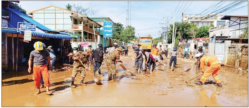
လမ်း၊ တံတားများ၊ ရပ်ကွက်၊ ကျေးရွာများအတွင်း၌ တင်ကျန်ခဲ့သည့်နွဲ့နွဲ့များ ရှင်းလင်းဆောင်ရွက်စဉ်။

သည်။ အဆိုပါ ဧယျာသီရိမြို့နယ်နှင့် ပျဉ်းမနားမြို့နယ်သို့ ဆက်သွယ်ထားရှိ သော မြို့နယ်ချင်းဆက် ဆင်သေ ချောင်းကူးတံတားသည် ဧယျာသီရိ မြို့နယ် စည်ပင်ကြီးကျေးရွာ၊ ချောင်း ကမ်းကြီးကျေးရွာ၊ ညောင်ပင်ကြီး ကျေးရွာ၊ သာယာကုန်းကျေးရွာ၊ ရုံးပင် စောင်းကျေးရွာနှင့် စည်ပင်သာယာ ကျေးရွာတို့မှ ကျောင်းသား ကျောင်းသူ များက ပျဉ်းမနားမြို့နယ်ရှိ အခြေခံပညာ အထက်တန်းကျောင်းများသို့ ကျောင်း တက်ရောက်ရာတွင် အသုံးပြုရသော ဆင်သေချောင်းကူး တံတားဖြစ်ကြောင်း သိရသည်။ ယင်းအပြင် ရေကြီးမှုကြောင့် ပျက်စီး မှုများဖြစ်ပေါ်ခဲ့သည့် လမ်း/တံတားများ ကိုလည်း လမ်းပန်းဆက်သွယ်ရေး အမြန် ပြန်လည် ကောင်းမွန်စေရန်အတွက် ကြိုးပမ်းဆောင်ရွက်လျက်ရှိရာ ပျက်စီး ခဲ့သည့် လမ်း/တံတားများကိုလည်း ယာယီသံပေါင် ဘေးလီတံတားများ အစားထိုး၍ အမြန်ဆုံးပြန်လည်ပြင်ဆင် ဆောင်ရွက်ပေးလျက် ရှိကြောင်းနှင့် ပြုပြင်ရန်ကျန်ရှိနေသည့် တံတားများကို လည်း အမြန်ဆုံးဆက်လက်ပြုပြင် ဆောင်ရွက်လျက်ရှိသည်။ သတင်းစဉ်