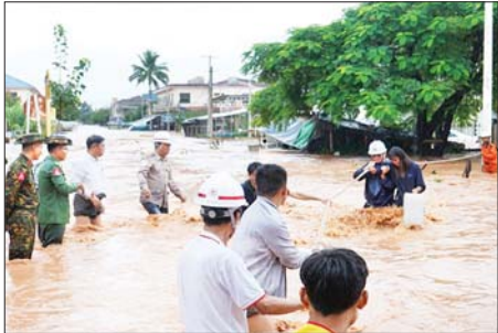
ရေဘေးသင့်သူများအား ရေဘေးကင်းလွှတ်ရာသို့ ကူညီရွှေ့ပြောင်းပေးစဉ်။

လုပ်ငန်းများ ဆောင်ရွက်နေမှုကို ကြိုက်ဒေသ တိုင်းစစ်ဌာနချုပ် တိုင်းမှူး၊ ဗိုလ်မှူးချုပ် စိုးလှိုင်နှင့် တာဝန်ရှိသူများက သွားရောက် ကြည့်ရှုအားပေးပြီး လိုအပ်သည် များ ပေါင်းစပ်ညှိနှိုင်းဆောင်ရွက် ပေးခဲ့ကြောင်း သတင်းရရှိ သည်။ သတင်းစဉ်