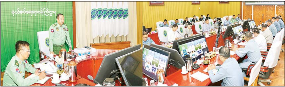
ပြည်ထောင်စုဝန်ကြီး ဒုတိယဗိုလ်ချုပ်ကြီး ထွန်းထွန်းနောင် နယ်စပ်ဒေသနှင့်တိုင်းရင်းသားလူမျိုးများ၏ ဖွံ့ဖြိုးတိုးတက်မှုအကောင်အထည်ဖော်ရေးလုပ်ငန်းကော်မတီ၏ ၂၀၂၅ - ၂၀၂၆ ဘဏ္ဍာရေးနှစ် စီမံကိန်းလုပ်ငန်းများလျာထားခြင်းနှင့်စပ်လျဉ်း၍ လုပ်ငန်းဆောင်ရွက်မည့် အစည်းအဝေးကျင်းပခြင်း