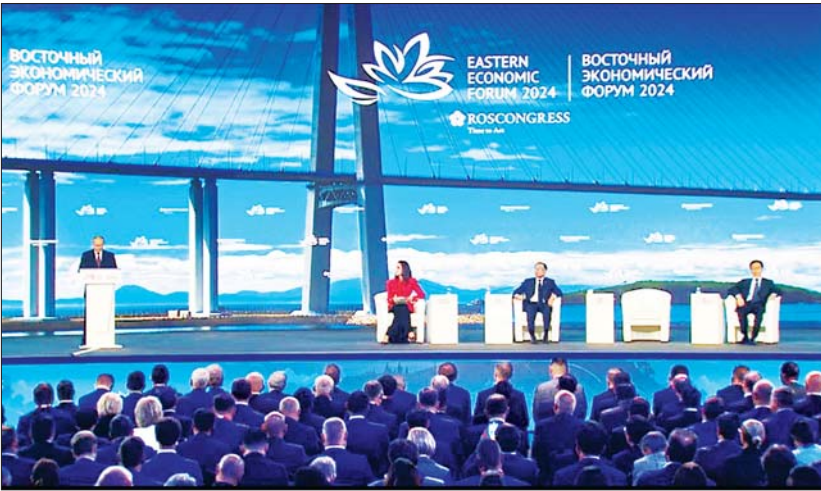
ရုရှားဖက်ဒရေးရှင်းနိုင်ငံ သမ္မတ မစ္စတာ ဗလာဒီမာပူတင် (၉) ကြိမ်မြောက် အရှေ့ဗဟူးစီးပွားရေးဖိုရမ် မျက်နှာစုံညီအစည်းအဝေး (Main Forum- Plenary Session) တွင် မိန့်ခွန်းပြောကြားစဉ်။

နေပြည်တော် စက်တင်ဘာ ၁၀ ရုရှားဖက်ဒရေးရှင်းနိုင်ငံ ဗလာဒီမာတော့ စတော့မြို့၌ ကျင်းပပြုလုပ်သည့် (၉) ကြိမ်မြောက် အရှေ့ဗဟူးစီးပွားရေးဖိုရမ်သို့ တက်ရောက်ခဲ့သည့် နိုင်ငံတော်စီမံအုပ်ချုပ်ရေးကောင်စီ အဖွဲ့ဝင်၊ ဒုတိယဝန်ကြီးချုပ်နှင့် ပို့ဆောင်ရေးနှင့် ဆက်သွယ်ရေးဝန်ကြီးဌာန ပြည်ထောင်စုဝန်ကြီး ဗိုလ်ချုပ်ကြီး မြထွန်းဦး ခေါင်းဆောင်သော မြန်မာကုန်သွယ်ရေးအဖွဲ့သည် စက်တင်ဘာ ၄ ရက် ညနေပိုင်းတွင် ရော့စ်ကွန်ဂရက် ရင်းနှီးမြှုပ်နှံမှုရန်ပုံငွေအဖွဲ့မှ ကိုယ်စားလှယ်အဖွဲ့နှင့် တွေ့ဆုံပြီး မြန်မာနိုင်ငံနှင့် ရုရှားနိုင်ငံ ရော့စ်ကွန်ဂရက် ရင်းနှီးမြှုပ်နှံမှု ရန်ပုံငွေအဖွဲ့တို့၏ ပူးပေါင်းဆောင်ရွက်လျက်ရှိသော လုပ်ငန်းများ၊ ဖြစ်ပေါ်တိုးတက်မှုအခြေအနေများနှင့် ရှေ့ဆက်လက်ဆောင်ရွက်မည့် ကိစ္စရပ်များနှင့် စပ်လျဉ်း၍ ရင်းနှီးပွင့်လင်းစွာ ဆွေးနွေးသည်။