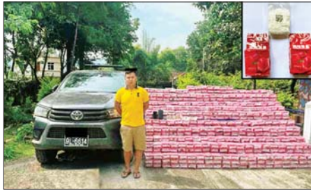
ရှောင်ဝယ်ခြင်းဖြစ်ကြောင်း သိရှိ ပြစ်မှုကျူးလွန်သူများအား စစ်ဆေး ရသဖြင့် ၎င်းအား ဥပဒေအရ ဖော်ထုတ်လျက်ရှိကြောင်း သတင်း အရေးယူထားရှိပြီး ကွင်းဆက် ရရှိသည်။ သတင်းစဉ်

နေပြည်တော် စက်တင်ဘာ ၁၀ ရှမ်းပြည်နယ်(အရှေ့ပိုင်း) ကျိုင်းတုံ မြို့နယ်တွင် ငွေကျပ် ၈ ဒသမ ၃၇ ဘီလီယံကျော်တန်ဖိုးရှိ အိုက်စ (မက်သ်အဖက်တမင်း) တစ်တန်ကျော် ဖမ်းဆီးရမိခဲ့ကြောင်း မြန်မာနိုင်ငံရဲတပ်ဖွဲ့မှ သိရသည်။ လုံခြုံရေး တပ်ဖွဲ့ဝင်များ ပါဝင်သော ပူးပေါင်းအဖွဲ့သည် စက်တင်ဘာ ၇ ရက် နံနက် ၄ နာရီခွဲတွင် ရှမ်းပြည်နယ် (အရှေ့ပိုင်း) ကျိုင်းတုံမြို့နယ် ယန်းကျိန်ကျေးရွာအနီး မိုင်းလား-